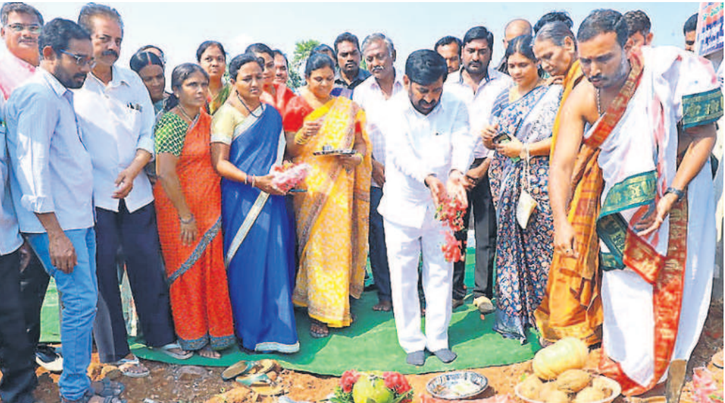
కేసారంలో బల్టాజు సంఘం కమ్యూనిటీ హాల్కు శంకుస్థాపన చేస్తున్న మంత్రి గుంటకండ్ల జగదీశ్వరెడ్డి