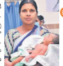
కేంద్రానికి తీసుకొచ్చారు. మూడు రోజుల నుంచి చికిత్స అందిస్తున్నారు. డాక్టర్లు దగ్గరుండి మంచిగా చూస్తున్నారు. ఇప్పటి వరకు ఒక్క పైసా కట్టలేదు. మందులు, పరికరాలన్నీ సర్కారే కడుతున్నది. మేం బయట చూపించుకుంటే లక్షలు అయ్యేవి. తెలంగాణ ప్రభుత్వం వల్లే మాకు ఉచితంగా వైద్యం అందింది.

నవజాత శిశు సంరక్షణ కేంద్రంలో ప్రభుత్వం అధునాతన యంత్రాలను అందుబాటులోకి తెచ్చింది. 23 వార్డులు, 8 ఫోటోథెరపీ యంత్రాలు, 3 సీపావ మిషన్లు పని చేస్తున్నాయి. అదే విధంగా ఒక వెంటిలేటర్ కూడా అందుబాటులో ఉంది. ముగ్గురు న్యూనల్యూ డాక్టర్లతో పాటు ప్రత్యేక శిక్షణ పొందిన నర్సులు, సిడియా ట్రైనింగ్ బ్యూండ్ 24 గంటలూ పని చేస్తుంటారు. ఇక్కడ వైద్యులతోపాటు అన్ని రకాల పరికరాలు, మందులు ఉచితంగా అందిస్తున్నారు. ట్రీట్ మెంట్ ముగిసాక డిశ్చార్జ్ సమయంలో సరిపడా మందులు ఇచ్చి పంపిస్తున్నారు. అదేవిధంగా ఫోటోథెరపీ కార్డు ఇస్తున్నారు. ప్రతి నెలా ప్రత్యేకంగా శిశు వైద్య పరిస్థితిని అడిగి తెలుసుకుంటున్నారు.