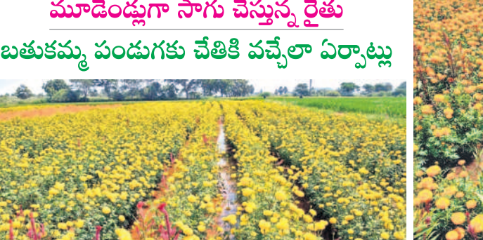
వీరబాసిన ముద్దబంతి పూలు

మూడేండ్లుగా సాగు చేస్తున్న రైతులకు బతుకమ్మ పండుగకు చేతికి వచ్చేలా ఏర్పాట్లు