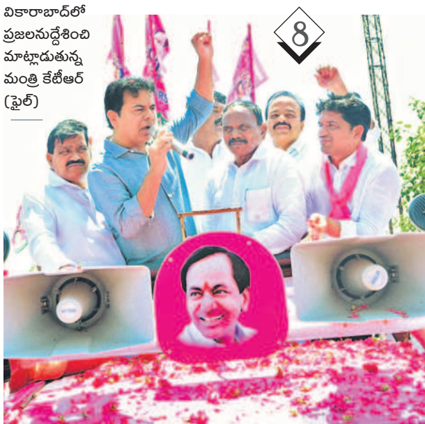
వికారాబాద్లో ప్రజలనుద్దేశించి మాట్లాడుతున్న మంత్రి కేటీఆర్ (ఫైల్)

శంకుస్థాపనలు, ప్రారంభోత్సవాలతో మంత్రులు, ఎమ్మెల్యేలు బిజీ బిజీ