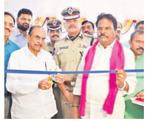
కడ్రాల్ పోలీస్ స్టేషన్ ను ప్రారంభిస్తున్న హోంమంత్రి మహమూద్ అలీ, ఎమ్మెల్యే జైపాల్ యాదవ్