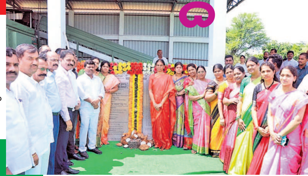
బడంగిపేట మున్సిపల్ కార్పొరేషన్ సూతన భవన శిలాఫలకాన్ని ప్రారంభిస్తున్న రాష్ట్ర విద్యాశాఖ మంత్రి పి సబితా ఇంద్రారెడ్డి

బడంగిపేట, అక్టోబర్ 7: కోట్లాది రూపాయలతో బడంగిపేట, మీరపేట మున్సిపల్ కార్పొరేషన్ల రూపురేఖలను మార్చుతున్నట్లు విద్యాశాఖ మంత్రి పి సబితా ఇంద్రారెడ్డి అన్నారు. శనివారం ఆమె సుడిగాలి పర్యటన చేసి బడంగిపేట మున్సిపల్ కార్పొరేషన్ పరిధిలో ఒకే రోజు రూ.75 కోట్ల నిధులతో చేపట్టనున్న, నిర్మాణం పూర్తైన పలు అభివృద్ధి పనులకు శంకుస్థాపనలు, ప్రారంభోత్సవాలు చేశారు. 16, 17, 18, 19, 21, 31 డిసెంబర్లో రూ.3.19 కోట్లతో చేపట్టనున్న పలు అభివృద్ధి పనులకు శంకుస్థాపన, రూ.9.2 కోట్లతో నిర్మించిన బడంగిపేట సూతన మున్సిపల్ కార్పొరేషన్ భవన ప్రారంభం.. అదేవిధంగా రూ.4.25 కోట్లతో ప్రజాభవనం, రూ.2.40 కోట్లతో కుర్చులగూడలో 24 కుల సంఘాల భవనాలకు, రూ.4.72 కోట్లతో కుర్చులగూడలో డీఆర్ఎస్ సెంటర్, నాడర్ గుల్లో డోహూల్ తదితర అభివృద్ధి పనులకు మంత్రి శంకుస్థాపనలు, ప్రారంభోత్సవాలు చేశారు. ఈ సందర్భంగా ఆమె మాట్లాడుతూ సీఎం కేసీఆర్ ప్రభుత్వం మౌలిక వసతుల కల్పనకు అధిక నిధులను వెచ్చిస్తున్నట్లు తెలిపారు. గత ఉమ్మడి ప్రభుత్వాల పాలనలో కుల వృత్తులను అప్పటి పాలకులు