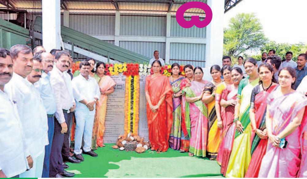
బడంగిపేట మున్సిపల్ కార్పొరేషన్ సూతన భవన శిలాఫలకాన్ని ప్రారంభిస్తున్న రాష్ట్ర విద్యాశాఖ మంత్రి పి సబితా ఇంద్రారెడ్డి

బడంగిపేట, అక్టోబర్ 7: కోట్లాది రూపాయలతో బడంగిపేట, మీరపేట మున్సిపల్ కార్పొరేషన్ల రూపురేఖలను మార్చుతున్నట్లు విద్యాశాఖ మంత్రి పి సబితా ఇంద్రారెడ్డి అన్నారు. శనివారం ఆమె సుడిగాలి పర్యటన చేసి బడంగిపేట మున్సిపల్ కార్పొరేషన్ పరిధిలో ఒకే రోజు రూ.75 కోట్ల నిధులతో చేపట్టనున్న, నిర్మాణం పూర్తైన పలు అభివృద్ధి పనులకు శంకుస్థాపనలు, ప్రారంభోత్సవాలు చేశారు. 16, 17, 18, 19, 21, 31 డిసెంబర్లలో రూ.3.19 కోట్లతో చేపట్టనున్న పలు అభివృద్ధి పనులకు శంకుస్థాపన, రూ.9.2 కోట్లతో నిర్మించిన బడంగిపేట సూతన మున్సిపల్ కార్పొరేషన్ భవన ప్రారంభం.. అదేవిధంగా రూ.4.25 కోట్లతో ప్రజాభవనం, రూ.2.40 కోట్లతో కుర్చులగూడలో 24 కుల సంఘాల భవనాలకు, రూ.4.72 కోట్లతో కుర్చులగూడలో డీఆర్ఎస్ సెంటర్, నాదర్ గుల్లో డోహోవాల్ తదితర అభివృద్ధి పనులకు మంత్రి శంకుస్థాపనలు, ప్రారంభోత్సవాలు చేశారు. ఈ సందర్భంగా ఆమె మాట్లాడుతూ సీఎం కేసీఆర్ ప్రభుత్వం మౌలిక వసతుల కల్పనకు అధిక నిధులను వెచ్చిస్తున్నట్లు తెలిపారు. గత ఉమ్మడి ప్రభుత్వాల పాలనలో కుల వృత్తులను అప్పటి పాలకులు