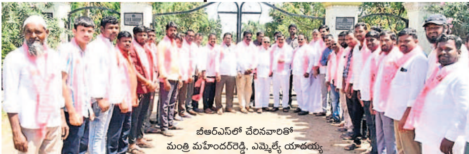
బీఆర్ఎస్ లో చేరినవారితో మంత్రి మహేందర్ రెడ్డి, ఎమ్మెల్యే యాదయ్య