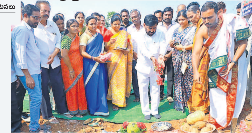
కేసారంలో బట్రాజు సంఘం కమ్యూనిటీ హాల్ కు శంకుస్థాపన చేస్తున్న మంత్రి గుంటకండ్ల జగదీశ్వరెడ్డి

కొత్త పనులు పూర్తి చేయాలన్న తపనతో.. గత తొమ్మిదేండ్లలో ఎవరూ ఊహించని విధంగా, ప్రతిపక్షాలు సైతం మెచ్చుకునేలా అభివృద్ధి కార్యక్రమాలు చేసిన మంత్రి జగదీశ్వరెడ్డి నేడు సమయం తక్కువగా ఉండడం.. నిధులు అందుబాటులో ఉండడంతో ఉరుకులు, పరుగులు పెట్టాల్సిన పరిస్థితి. ఇప్పటి వరకు తెచ్చిన నిధులు, చేసిన అభివృద్ధికి కొనసాగింపుగానే గత బిరు రోజులుగా వందల కోట్లు వెచ్చించి ప్రారంభోత్సవాలు, శంకుస్థాపనలు చేస్తున్నారు. గతంలో శంకుస్థాపన చేసిన ఏ ఒక్క పని కూడా పెండింగ్ లేకపోగా నేడు శంకుస్థాపనలు చేస్తున్న పనులను కూడా పూర్తిచేయాలన్న తపనతో ఉరుకులు, పరుగులు పెడుతున్నారు. మంత్రి పనితీరుపై జనం చర్చించుకుంటూ.. ఇలాంటి నాయకుడిని ఇప్పటి వరకు సూర్యాపేట చరిత్రలో చూడలేదని, మంత్రి హ్యూటీక్ విజయం సాధించడం ఖాయమంటున్నారు. అభివృద్ధి పనులతో బీఆర్ఎస్ శ్రేణుల్లో రోజు రోజుకూ జోషి పెరుగుతుండగా, వివక్షల వెన్నులో వణుకు వస్తుందని పార్టీ శ్రేణులు సంతోషం వ్యక్తం చేస్తున్నాయి.