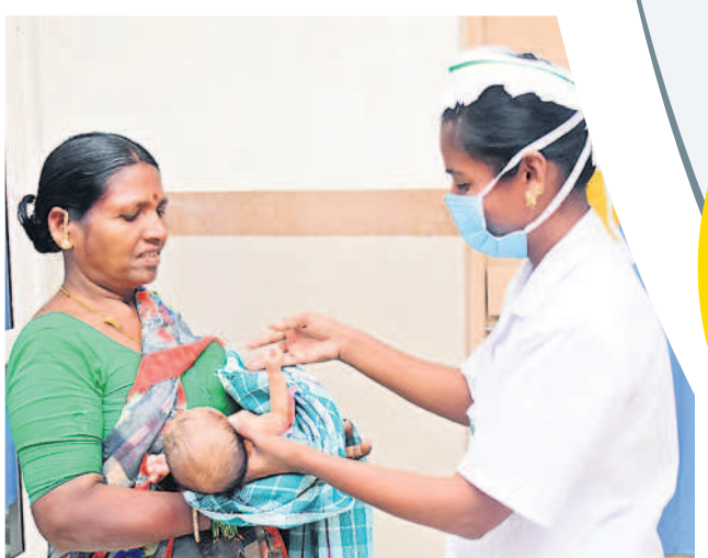
నవజాత శిశువును కుటుంబ నిభ్యులకు అందిస్తున్న నర్సు

భువనగిరి ఏరియా ఆస్పత్రిలో సేవలు అదుర్స్ అందుబాటులో అధునాతన పరికరాలు, యంత్రాలు పసిరికలు, ఫోటోథెరపీ, శ్వాస సమస్యలకు వైద్యం నెలకు 80మంది పసి పిల్లలకు పైగా డ్రీట్ మెంట్ పేదలకు రూ.లక్షల్లో తగ్గుతున్న ఆర్థిక భారం జిల్లాలో తగ్గిన శిశు మరణాల రేటు