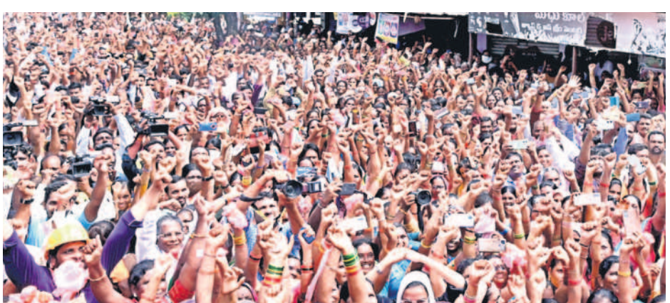
మండల మంత్రి కేటీఆర్ రోడ్ షోలో జై తెలంగాణ నివాసాలు చేస్తున్న మహిళలు

ప్రారంభోత్సవాలు, శంకుస్థాపనలతో దూసుకెళ్తున్న జననేతలు