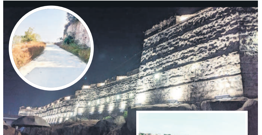
విద్యుత్ సౌకర్యం వెలిగిపోతున్న శ్యాంగర్ కోట, కోటలోకి వెళ్లడం ప్రభుత్వం ఇటీవల వేసిన సీన్ రోడ్డు

చారిత్రక చెరువుల్లో బోటింగ్ కోటలు, బురుజులకు కొత్తదాటు రూ.38 కోట్లతో ఫోటో లేన్ సిక్వీక్ స్వాట్ గా శ్యాంగర్ కోట రూ.12 కోట్లతో హరిత హోటల్ నిర్మాణం