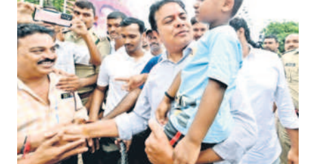
మండల మంత్రి పట్టణంలో చిన్నారులను ఎత్తుకున్న మంత్రి కేటీఆర్