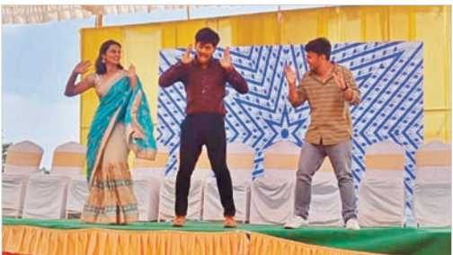
డాన్స్ తో అలరిస్తున్న వైద్యవిద్యార్థులు