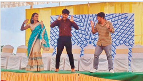
డాన్స్ తో అలరిస్తున్న వైద్యవిద్యార్థులు