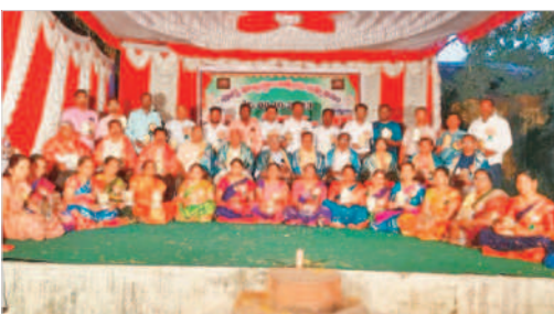
రంగాపూర్లో ఆత్మీయ సమ్మేళనంలో పాల్గొన్న పూర్వ విద్యార్థులు

వంగూరు, అక్టోబర్ 8: మండలంలోని వంగూరు, రంగాపూర్ గ్రామాల్లో ప్రభుత్వ పాఠశాలలో చదువుకున్న పూర్వ విద్యార్థులు ఆదివారం ఆత్మీయ సమ్మేళాన్ని నిర్వహించారు. వంగూరు ప్రభుత్వ పాఠశాలలో 1990-91 బ్యాచ్ పదో తరగతి విద్యార్థులు, రంగాపూర్ ప్రభుత్వ ఉన్నత పాఠశాలలో 1998-99 బ్యాచ్ పదో తరగతి విద్యార్థులు ఆనాటి గురువులను సన్మానించడంతోపాటు విద్యార్థులు అలనాటి జ్ఞాపకాలను నెమరువేసుకున్నారు. ఆత్మీయ సమ్మేళనాలు ఎంతో ఆత్మీయంగా జరుపుకోవడం విశేషమని పేర్కొన్నారు. కార్యక్రమంలో పూర్వ విద్యార్థులు పాల్గొన్నారు.