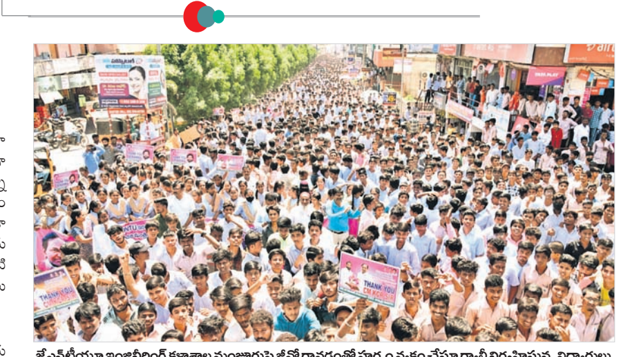
జేఎన్టీయూ ఇంజనీరింగ్ కళాశాల మంజూరుపై జీవో రావడంతో హర్షం వ్యక్తం చేస్తున్న రాల్చీ నిర్వహిస్తున్న విద్యార్థులు

మంత్రిగా శ్రీనివాస్ గౌడ్ నర్సింగ్ కాలేజీ, ఫిజియోథెరపీ కాలేజీ, డిగ్రీ కాలేజీలు, కస్తూర్బా జ్యోతిరావు పూలే జూనియర్ కాలేజీలు, అనేక రెసిడెన్షియల్ పాఠశాలను నెల కొల్చి మహబూబ్ నగర్ ను విద్యాభావీగా మార్చారు. ప్రభుత్వ పాఠశాలలు, కళాశాలల్లో అడ్మిషన్స్ పుల్ అవుతున్నాయి. దీనికి అనుబంధంగా పాలిటెక్నిక్, సాంకేతిక కళాశాలలో కూడా వసతులు మెరుగుపరచడంతో విద్యార్థులు రాష్ట్రవ్యాప్తంగా ఉత్తమ రాంకులకు సాధించారు. దీనికి తోడు జిల్లా కేంద్రంలో స్టేడియంలో వసతులు, శ్రీధా సాకార్యాల కల్పించారు.