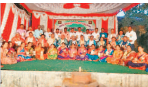
రంగాపూర్లో ఆత్మీయ సమ్మేళనంలో పాల్గొన్న పూర్వ విద్యార్థులు

వంగూరు, అక్టోబర్ 8: మండలంలోని వంగూరు, రంగాపూర్ గ్రామాల్లో ప్రభుత్వ పాఠశాలలో చదువుకున్న పూర్వ విద్యార్థులు ఆదివారం ఆత్మీయ సమ్మేళాన్ని నిర్వహించారు. వంగూరు ప్రభుత్వ పాఠశాలలో 1990-91 బ్యాచ్ పదో తరగతి విద్యార్థులు, రంగాపూర్ ప్రభుత్వ ఉన్నత పాఠశాలలో 1998-99 బ్యాచ్ పదో తరగతి విద్యార్థులు ఆనాటి గురువులను సన్మానించడంతోపాటు విద్యార్థులు అలనాటి జ్ఞాపకాలను నెమరువేసుకున్నారు. ఆత్మీయ సమ్మేళనాలు ఎంతో ఆత్మీయంగా జరుపుకోవడం విశేషమని పేర్కొన్నారు. కార్యక్రమంలో పూర్వ విద్యార్థులు పాల్గొన్నారు.