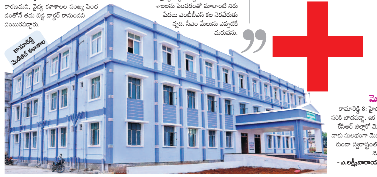
కామారెడ్డి మెడికల్ కళాశాల