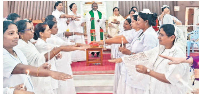
చర్చిలో క్యాండిల్స్ వెలిగించి, ప్రతిజ్ఞ చేస్తున్న నర్సింగ్ సిబ్బంది