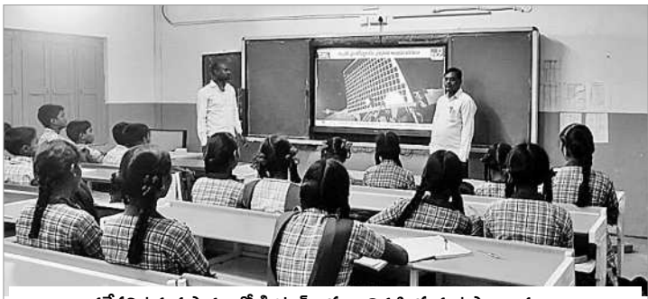
వడ్డేపల్లి ఉన్నత పాఠశాలలో డిజిటల్ క్లాసులు నిర్వహిస్తున్న ఉపాధ్యాయులు

వడ్డేపల్లి ఉన్నత పాఠశాలలో డైనింగ్ హాల్ కు రూ. 14 లక్షలు, ఎలక్ట్రికల్ రివేరింగ్ కు రూ. 2 లక్షలు, తాగునీటి సమస్య పరిష్కారానికి రూ. 1.20 లక్షలు, పాఠశాలలో వివిధ రకాల అభివృద్ధి పనులకు రూ. 2 లక్షలు, ప్రహారీ నిర్మాణానికి రూ. 8.75 లక్షలు, ముత్రశాలలు, వంట గదులను నిర్మించారు. ప్రాథమిక పాఠశాల ప్రహారీ నిర్మాణానికి రూ. 2.9 లక్షలు, మరుగుదొడ్లు, ఇతర పనులకు రూ. 7 లక్షలు కేటాయించారు. పనులన్నీ పూర్తికావడంతో పాఠశాల రుపురేఖలు మరిపోయాయి. కార్పొరేట్ పాఠశాలను తలదన్నెలా వడ్డేపల్లి పాఠశాలను అభివృద్ధి చేయడంతో మండలంలోనే ఆదర్శంగా నిలిచింది. ప్రభుత్వ నిధులతో కిచెన్ షెడ్, మరుగుదొడ్ల నిర్మాణం, తాగునీటి సౌకర్యం కల్పించారు. విద్యుద్దీకరణ పనులు చేపట్టారు. ఇతర మరమ్మత్తులు, భవనాలు, క్లౌనింగ్ పనియింటింగ్ చేయించారు. పాఠశాల ఆరుబయట గోడలకు గుంటు వేయగా, తరగతి గదుల్లో గోడలకు ఒకే రంగును ఉపయోగించారు. తరగతి గదుల్లో గ్రీన్ బోర్డులు, 40 డ్యూయల్ డెస్కులు ఏర్పాటు చేశారు. ఆధునాతన హంగులతో వడ్డేపల్లి ఉన్నత పాఠశాల కార్పొరేట్ కు దీటుగా అభివృద్ధి చేశారు.