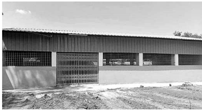
వడ్డేపల్లి ఉన్నత పాఠశాలలో విద్యార్థుల కోసం నిర్మించిన డైనింగ్ హాల్