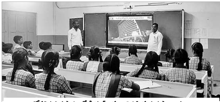
వడ్డేపల్లి ఉన్నత పాఠశాలలో డిజిటల్ క్లాసులు నిర్వహిస్తున్న ఉపాధ్యాయులు

వడ్డేపల్లి ఉన్నత పాఠశాలలో డైనింగ్ హాల్ కు రూ. 14 లక్షలు, ఎలక్ట్రికల్ రిపేరింగ్ కు రూ. 2 లక్షలు, తాగునీటి సమస్య పరిష్కారానికి రూ. 1.20 లక్షలు, పాఠశాలలో వివిధ రకాల అభివృద్ధి పనులకు రూ. 2 లక్షలు, ప్రహారీ నిర్మాణానికి రూ. 8.75 లక్షలు, ముత్రశాలలు, వంట గదులను నిర్మించారు. ప్రాథమిక పాఠశాల ప్రహారీ నిర్మాణానికి రూ. 2.9 లక్షలు, మరుగుదొడ్లు, ఇతర పనులకు రూ. 7 లక్షలు కేటాయించారు. పనులన్నీ పూర్తికావడంతో పాఠశాల రుపురేఖలు మరిపోయాయి. కార్యారంభ పాఠశాలను తలదన్నెలా వడ్డేపల్లి పాఠశాలను అభివృద్ధి చేయడంతో మండలంలోనే ఆదర్శంగా నిలిచింది. ప్రభుత్వ నిధులతో కిచెన్ షెడ్, మరుగుదొడ్ల నిర్మాణం, తాగునీటి సౌకర్యం కల్పించారు. విద్యుద్దీకరణ పనులు చేపట్టారు. ఇతర మరమ్మతులు, భవనాలు, క్లౌనింగ్ పనియింటింగ్ చేయించారు. పాఠశాల ఆరుబయట గోడలకు గుంటు వేయగా, తరగతి గదుల్లో గోడలకు ఒకే రంగును ఉపయోగించారు. తరగతి గదుల్లో గ్రీన్ బోర్డులు, 40 డ్యూయల్ డెస్కులు ఏర్పాటు చేశారు. ఆధునాతన హంగులతో వడ్డేపల్లి ఉన్నత పాఠశాల కార్యారంభం దీటుగా అభివృద్ధి చేశారు.