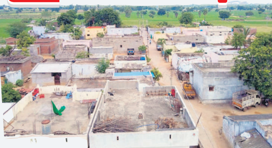
నూతన గ్రామ పంచాయతీగా ఏర్పడిన కడపగండి తండా

స్వరాష్ట్రంలో చేరువైన అభివృద్ధి, సంక్షేమ ఫలాలు 15 పంచాయతీల ఏర్పాటుతో స్వయం పాలన రోడ్లు, డ్రైనేజీల నిర్మాణంతో కొత్త కళ ఇంటింటికీ మిషన్ భగీరథ సీక్ల బంజారాభవన్, గిరిజన గురుకుల పాఠశాలల మంజూరు సీఎం కేసీఆర్ సారథ్యంలో పెద్దపత్తుల నిధులు విడుదల సమగ్రాభివృద్ధి సాధిస్తున్న తండాలు