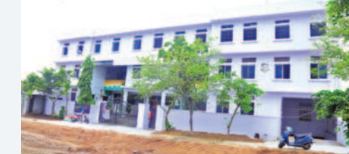
మండల కేంద్రంలో బాలర గిరిజన గురుకుల పాఠశాల ఏర్పాటు చేసిన తాత్కాలిక భవనం

ముసుగేడు ఉప ఎన్నిక సందర్భంగా మండల కేంద్రంలో గిరిజన గురుకుల పాఠశాల మంజూరు చేస్తామని బీఆర్ఎస్ ప్రజాప్రతినిధులు హామీ ఇచ్చారు. ఆ మేరకు నారాయణ పురం మండల కేంద్రంలో బాలర గిరిజన గురుకుల పాఠశాలను మంజూరు చేస్తూ సీఎం కేసీఆర్ ఉత్తర్వులు జారీ చేశారు. ప్రస్తుతం తాత్కాలిక భవనంలో 5, 6వ తరగతులు నిర్వహిస్తుండగా.. 50మంది వరకు విద్యార్థులు అడ్మిషన్లు తీసుకున్నారు. వచ్చే ఏడాది నుంచి పూర్తి స్థాయిలో అందుబాటులోకి రానున్నది.