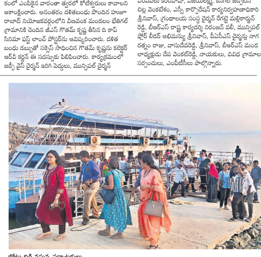
బోటు దిగి వస్తున్న పర్యాటకులు

నందీకొండలో పర్యాటకుల సందడి నాగార్జునసాగర్లో అధికారం వర్షాలకు సంబంధించి పర్యాటకులు పెద్ద సంఖ్యలో తరలివచ్చారు. దాంతో బుద్ధవనం, లాంటి స్థానాల్లో సాగర్ ద్వారా వలసలను సందడి నెలకొంది. తెలంగాణ టూరిజం శాఖ కృష్ణా నదిలో ఏర్పాటు చేసిన లాంటిలో జాతి బ్రీడు, నాగార్జున కొండకు వెళ్లేందుకు పర్యాటకులు ఆసక్తి చూపారు. బుద్ధవనంలో బుద్ధుడి జీవిత గాథలు తెలిపే అష్టాంగ మూర్తి, మహాసూర్యుని దర్శించుకున్నారు.