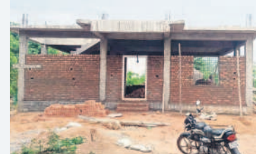
బిబ్బిరంలో జరుగుతున్న గ్రామ పంచాయతీ భవన నిర్మాణ పనులు

గిరిజన తండాల ప్రజలను సీఎం కేసీఆర్ సొంత బిడ్డలా చూసుకుంటున్నారు. మండలంలో 16 తండాలును గ్రామ పంచాయతీలుగా మార్చడంతోపాటు 10 గ్రామ పంచాయతీ భవనాలు మంజూరు చేశారు. తండాలో సీసీ రోడ్లు, అండర్ గ్రౌండ్ డ్రైనేజీ పనులు పూర్తి చేశారు. మా గిరిజన తండాల ప్రజలకు ఇచ్చిన ప్రతి హామీని నెరవేర్చిన ఎమ్మెల్యే కూసుకుంట్ల ప్రభాకర్ రెడ్డికి జీవితాంతం రుజువయి ఉంటుంది. - డివిలాల, వాళ్లతోపాటు సర్పంచ్