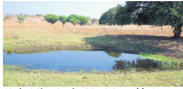
గతంలో ఐదు దోనాల తండా గిరిజన ప్రజలకు ఈ చెలిమె సీక్ల దిక్కు

గ్రౌండ్ డ్రైనేజీలు, పాల్టీ సెంటర్లు, గిరిజన గురుకుల పాఠశాల, గిరిజన భవనం, ఎన్నో ఏండ్లుగా పెండింగ్లో ఉన్న బీటీ రోడ్లకు నిధులు మంజూరు చేయడంతో గిరిజన తండాలు అభివృద్ధి పథంలో పయనిస్తున్నాయి.