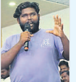
నాకు చిన్నప్పటి నుంచి సినీమా తీయాలనే తపన ఉండేది. కానీ ఆర్థిక పరిస్థితులతో సాధ్యం కాలేదు.

10 కొత్త గ్రామపంచాయతీ భవనాలు మంజూరు మండలంలో 24 గిరిజన తండాలు ఉన్నాయి. అవి గతంలో మేజర్ గ్రామ పంచాయతీలకు అవసరమైన గ్రామాలగా ఉండేవి. దాంతో ప్రతి చిన్న పని కోసం గ్రామ పంచాయతీలకు వెళ్లాల్సి రావడంతో ప్రజలు తీవ్ర ఇబ్బందులు పడేవారు. ఈ క్రమంలో తండాలను గిరిజన సేవ పాలనాలోకి తెచ్చేందుకు సీఎం కేసీఆర్ 15 కొత్త గ్రామ పంచాయతీలు ఏర్పాటు చేశారు. ఉప ఎన్నికల్లో ఇచ్చిన హామీ మేరకు 10 గిరిజన గ్రామ పంచాయతీ భవనాలను మంజూరు చేశారు. ఒక్కో భవనానికి రూ.20 లక్షలు కేటాయింపారు. అదేవిధంగా ప్రతి తండాకు రూ.25 లక్షలు కేటాయింపడంతో సీసీ రోడ్లు, డ్రైనేజీ నిర్మాణాలు చేపట్టారు.