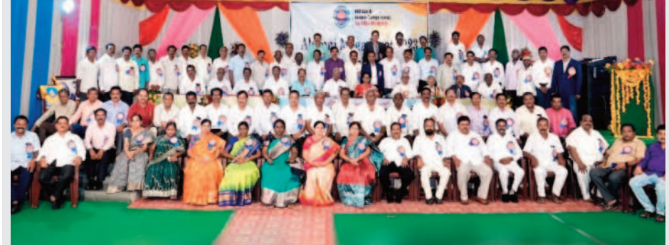
ఘనంగా పూర్వ విద్యార్థుల సమ్మేళనం