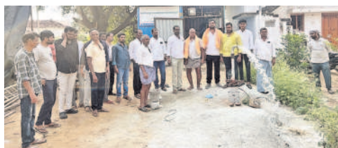
మొయినాబాద్, అక్టోబర్ 8 : మండల పరిధిలోని కాశీంబొలి