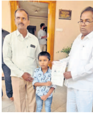
ఎల్ఎఫ్సీని అందజేస్తున్న ఎంపీ రాములు

ఆమనగల్లు, అక్టోబర్ 8 : ముఖ్యమంత్రి సహాయ నిధి పథకం నిరుపేదలకు వరంలా మారిందని నాగర్ కర్నూల్ ఎంపీ పోతుగంటి రాములు అన్నారు. ఎంపీ సహకారంతో మండల పరిధిలోని శెట్టిపల్లి గ్రామానికి చెందిన వెంకటయ్యకు రూ.1.25 లక్షల ఎల్ఎఫ్సీ ఎంపీ రాములు మంజూరైంది. ఆదివారం హైదరాబాద్ లోని తన నివాసంలో లబ్ధిదారుడికి ఆయన ఎల్ఎఫ్సీని అందజేశారు. ఈ సందర్భంగా ఎంపీ మాట్లాడుతూ అన్ని వర్గాల సంక్షేమమే ధ్యేయంగా బీఆర్ఎస్ ప్రభుత్వం పనిచేస్తున్నదని తెలిపారు. ముఖ్యమంత్రి కేసీఆర్ అమలు చేస్తున్న సంక్షేమ పథకాలు ఏదో ఒక రూపంలో ప్రతి ఇంటికి చేరుతున్నాయన్నారు. మరోసారి అధికారంలోకి రావడం ఖాయమన్నారు.