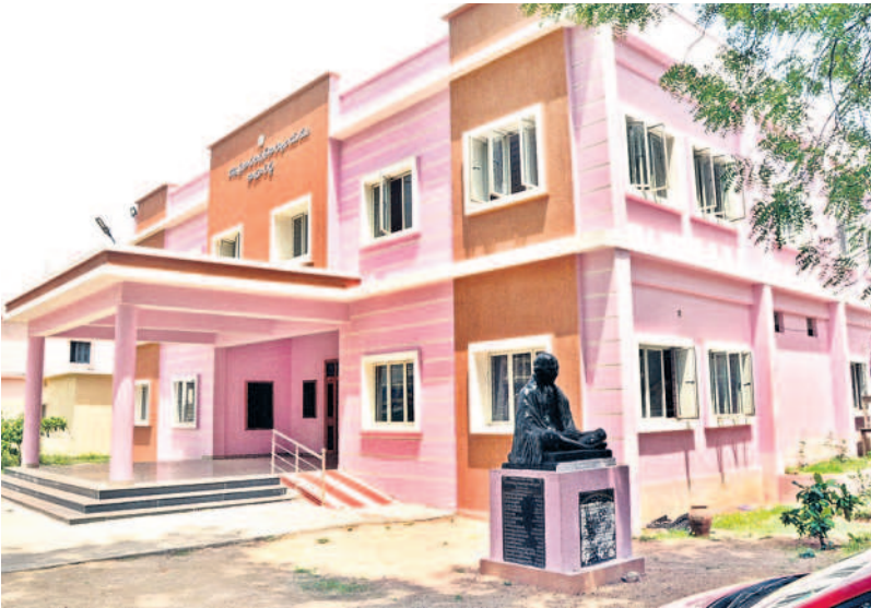
కామారెడ్డి జిల్లా పరిషత్ కార్యాలయం

నిజామాబాద్, అక్టోబర్ 10 (నమస్తే తెలంగాణ ప్రతినీధి) : స్వరాష్ట్రంలో సూక్ష్మ పరిపాలనకు మొదలుగా అవకాశం లభించింది. తక్కువ విస్తీర్ణం... తక్కువ జనాభాతో కూడిన జిల్లాల ఏర్పాటుతో పాలనలో దూసుకుపోతున్నది. ఉమ్మడి నిజామాబాద్ జిల్లాలో దాదాపు 30 లక్షల జనాభా ఉండేది. ఈ ప్రాంతం రెండుగా జిల్లాలుగా విడిపోవడంతో పర్యవేక్షణ సులువైంది. ప్రభుత్వ పరిపాలన వ్యవస్థలు రెండు విడిపోవడంతో ప్రజల చెంతకు ప్రభుత్వం ఆరిచిన ఫలాలు చేరుతున్నాయి. పెరిగిన జనాభాకు అనుగుణంగా జిల్లాలను పునర్విభజన చేసుకోవడం ద్వారా ఎనలేని పురోగతి కనిపిస్తున్నది. 2016, అక్టోబర్ 11న పురుషోత్తం పోసుకున్న కొత్త జిల్లాల స్వరూపం నేడు అద్వితీయమైన ప్రగతితో దూసుకుపోతున్నాయి. ఒకప్పుడు సువిశాల విస్తీర్ణంతో కూడిన నిజామాబాద్ భౌగోళిక పరిస్థితుల దృష్ట్యా ఏ మూలకు వెళ్లి రావాలన్నా 24 గంటలు పట్టేది. ఒక రోజంతా ఒక ప్రాంతానికే సరిపోయేది. నిరంతర పర్యవేక్షణలో లోపాలు, తదానూ పారదర్శకతలో లోటుపాట్లు వెరసిన కచ్చితత్వంలో నష్టాలు వంటివి కనిపించేవి. మరిప్పుడు నూతన జిల్లాలలో పరిపాలన నూతన పంథాలో సాగుతున్నది. ప్రతి ఊరు, మండలానికి, నియోజకవర్గం స్వయంగా ఉన్న తాధికారుల పర్యవేక్షణ పెరిగింది. సుపరిపాలనకు అధికార వికేంద్రీకరణ అన్నది రాచబాటను పర్చి