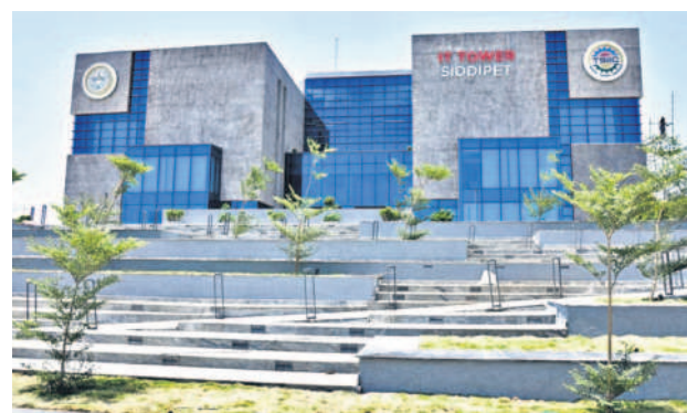
సిద్దిపేటలో ఏర్పాటు చేసిన ఐటీ టవర్