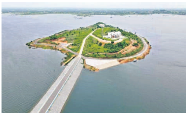
చిన్నకోడూరు మండలంలోని రంగనాయకసాగర్