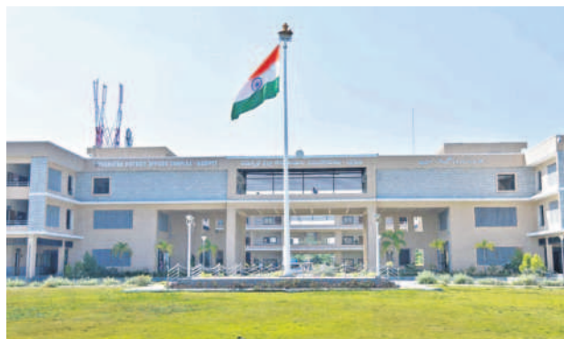
సిద్దిపేటలోని సమీకృత కలెక్టరేట్