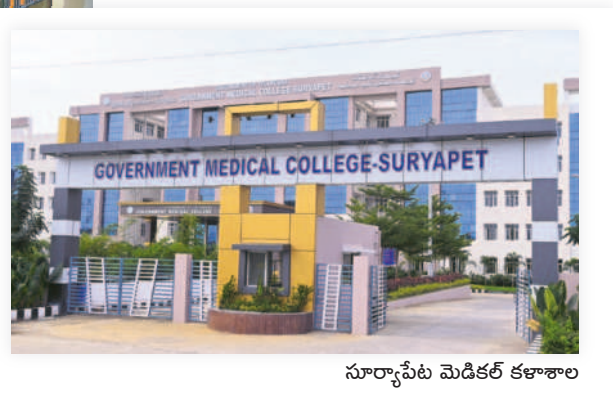
సూర్యాపేట మెడికల్ కళాశాల