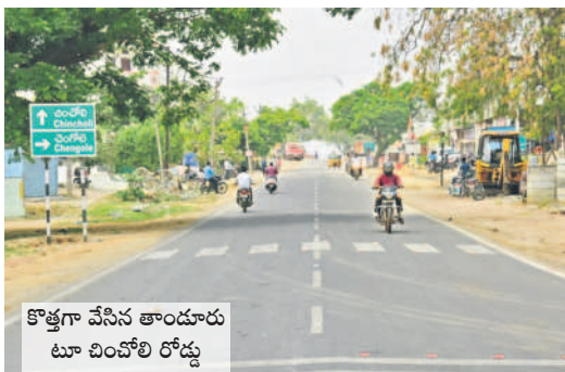
కొత్తగా వేసిన తాండూరు టూ చిచ్ రోడ్డు

- వికారాబాద్, అక్టోబర్ 10, (నమస్తే తెలంగాణ)