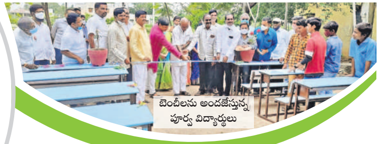
బెంచీలను అందజేస్తున్న పూర్వ విద్యార్థులు