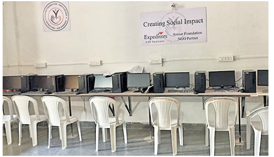
Creating Social Impact Expeditors Avasar Foundation NGO Partner