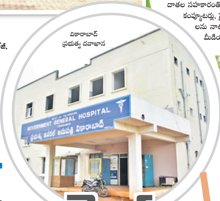
వికారాబాద్ ప్రభుత్వ దవాఖాన