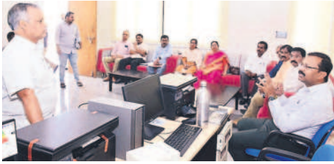
కంట్రోల్ రూమ్ ను పరిశీలిస్తున్న కలెక్టర్ వినయ కృష్ణారెడ్డి

భువనగిరి కలెక్టరేట్, అక్టోబర్ 10 : ఎన్నికల ప్రవర్తనా నియమావళిని పక్కపూర్వంగా అమలు చేయాలని జిల్లా కలెక్టర్ వినయకృష్ణారెడ్డి నోడల్ టీమ్ అధికారులను ఆదేశించారు. మంగళవారం జిల్లా కలెక్టరేట్ సమావేశ మందిరంలో