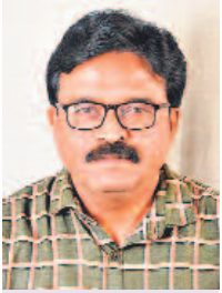
'తెలంగాణ - కాంగ్రెస్ పార్టీ - 60 ఏళ్ల వంచనా పర్యం' పై చరిత్ర పరిశోధకుడు డాక్టర్ ఎం. శ్రీనివాసన్ రాసిన ప్రత్యేక కథనాలు నేటి నుంచి..

మాటల ఘాటుతో, గ్యాంబిల్ ఆటతో ముందుకు వస్తున్న కాంగ్రెస్ పార్టీ అసలు స్వభావమేమిటో తెలుసుకోవాలంటే 60 ఏళ్ల చరిత్ర పుస్తకాన్ని ఒక్కసారి తిరగవేయాల్సింది! ఇది విమర్శలు కావు.. ఆరోపణలు అంతకంటే కావు.. అబద్ధాలు ఎంత మాత్రమూ కాదు.. 60 ఏళ్ల చరిత్రలో లక్షాధికం నిజార్థాలు వాస్తవాలి.