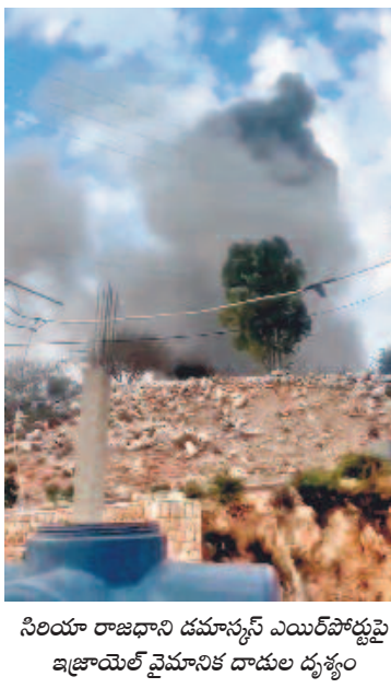
సిరియా రాజధాని డమాస్కస్ ఎయిర్పోర్టుపై ఇజ్రాయెల్ వైమానిక దాడుల దృశ్యం

ఎయిర్పోర్టులపై ఇజ్రాయెల్ వైమానిక దాడులు నిన్ను తెబనాన్ లోని టార్గెట్లపై కూడా బాంబులు