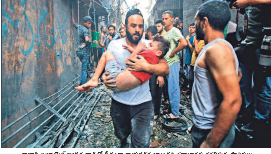
గాజాపై ఇజ్రాయెల్ జరిపిన దాడిలో తీవ్రంగా గాయపడిన బాలుడిని దవాఖానకు తరలిస్తున్న స్థానికులు

గంగాజలంపై జీఎస్టీ వేసే తగ్గిన కేంద్ర సర్కార్ పన్ను లేదని సీబీఐసీ వివరణ ఎన్నికల వల్లే 'యూటర్న్'?! > 7