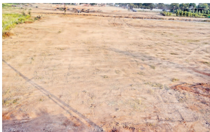
16న జనగామలో సీఎం సభ కోసం మైదానం చదును చేస్తున్న సిబ్బంది