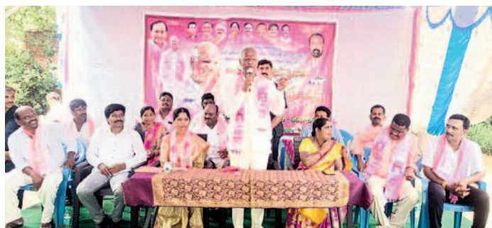
బీఆర్ఎస్ కార్యకర్తల విస్తృతస్థాయి సమావేశంలో మాట్లాడుతున్న ఎమ్మెల్యే కడియం