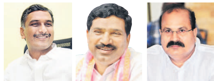
మంత్రి హరీశ్ రావు