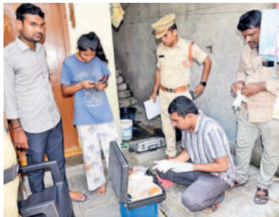
ఆధారాలు సేకరిస్తున్న క్లౌస్ టీం