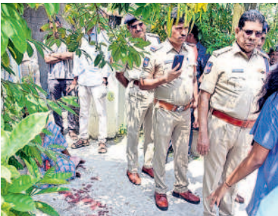
ఘటనా స్థలాన్ని పరిశీలిస్తున్న డీసీపీ బారి