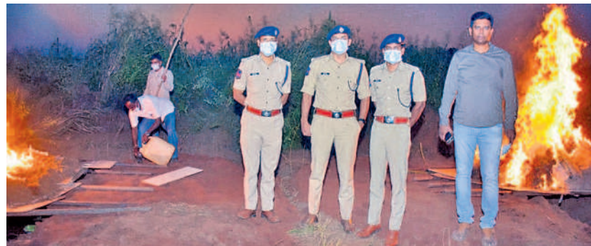
ములుగు : గంజాయిని దహనం చేస్తున్న ఎస్పీ, ఓఎస్సీ, ఏఎస్సీ