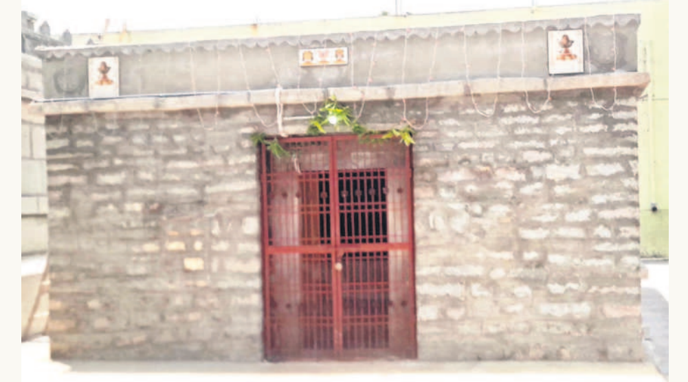
శ్రీహయగ్రీవ స్వామి ఆలయం