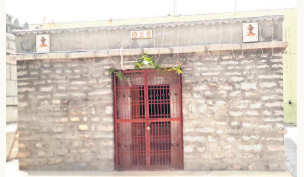
శ్రీహయగ్రీవ స్వామి ఆలయం