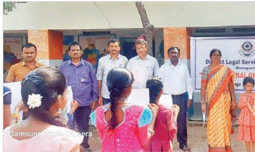
గుమ్మడంలో విద్యార్థులకు అవగాహన కల్పిస్తున్న అధికారులు