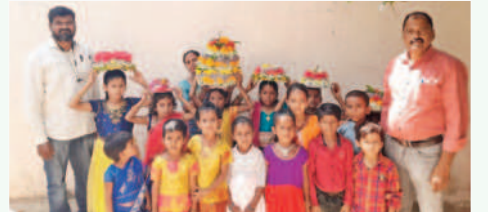
బతుకమ్మలతో రాజపేట పెద్దతండా పాఠశాల విద్యార్థులు