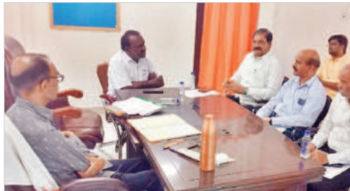
సమావేశంలో పాల్గొన్న అధికారులు, ప్రజాప్రతినిధులు