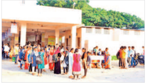
వనపర్తి బస్టాండ్ లో బస్సుల కోసం వేచి ఉన్న విద్యార్థులు

వనపర్తి టౌన్, అక్టోబర్ 12: దసరా పండుగను పురస్కరించుకొని జిల్లావ్యాప్తంగా అన్ని ప్రభుత్వ, ప్రైవేట్ పాఠశాలలకు శుభవారం నుంచి సెలవులను ప్రకటించారు. ఈ సెల 13 నుంచి 25 వరకు దసరా సెలవులు ప్రభుత్వం ప్రకటించింది. ఈ సెల 5 నుంచి 11వ తేదీ వరకు విద్యార్థులకు ఏఎస్ 1 (సమ్మెటీవ్) పరీక్షలు నిర్వహించారు. పరీక్షలు ముగియడంతో విద్యార్థులు తమ గురుకుల, సంక్షేమ హాస్టళ్ళు, టీసీ వెల్ఫేర్, మైన్ డివీజన్ సంక్షేమ హాస్టళ్ళ నుంచి విద్యార్థులు తమ తల్లిదండ్రులతో సొంత ఖైక్లు, ఆటోలు, బస్సుల్లో తమ గ్రామాలకు తరలివెళ్లారు. విద్యార్థులకు