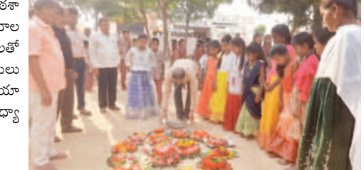
మూసాపేట : పోలింగ్ పల్లిలో బతుకమ్మ ఆడుతున్న విద్యార్థులు

మూసాపేట, అక్టోబర్ 12 : ప్రభుత్వ పాఠశాలలో పరీక్షలు ముగిసి దసరా నవరాత్రి ఉత్సవాల సెలవులు రావడంతో విద్యార్థులు బతుకమ్మలతో ఆడి పాడారు. అనంతరం బతుకమ్మ పాటలు పాడుతూ నృత్యం చేశారు. కార్యక్రమంలో ఆయా పాఠశాలల ప్రధానోపాధ్యాయులు, ఉపాధ్యాయులు, విద్యార్థులు పాల్గొన్నారు.