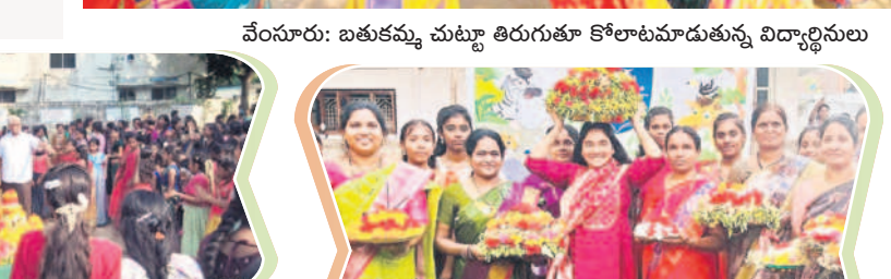
ఐమ్మం ఎడ్యుకేషన్ : నిర్మల్ వ్యధయో పాఠశాలలో