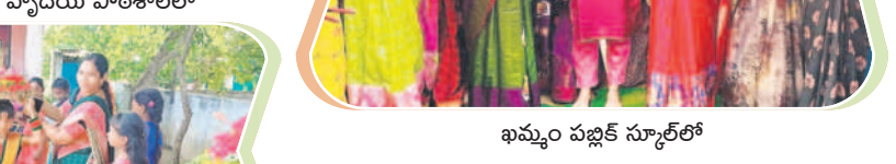
ఐమ్మం పబ్లిక్ స్కూల్ లో