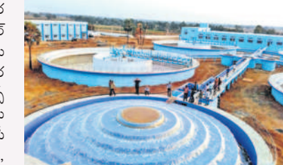
జీజీచెరువులోని డీడబ్ల్యూటీపీకి 700 ఆవాస ప్రాజెక్టులకు నీరు అందించే మోటర్లు

పాలేరు లిజర్వాయర్ నుంచి పంపుసెట్ల ద్వారా రావాల్సిన జీజీచెరువు దగ్గర గుట్టపై నిర్మించిన బ్యాంక్ లను తరలించుతూ జిల్లాలోని 30 మండలాల పరిధిలోని 7 లక్షల కుటుంబాలకు శుద్ధజలం సరఫరా అవుతున్నది. కేంద్రం పరిధిలో మొత్తం 1,08,000 మంది నీటి ట్యాంకులు ఉన్నాయి. రోజుకు 125 క్యూసెక్కుల