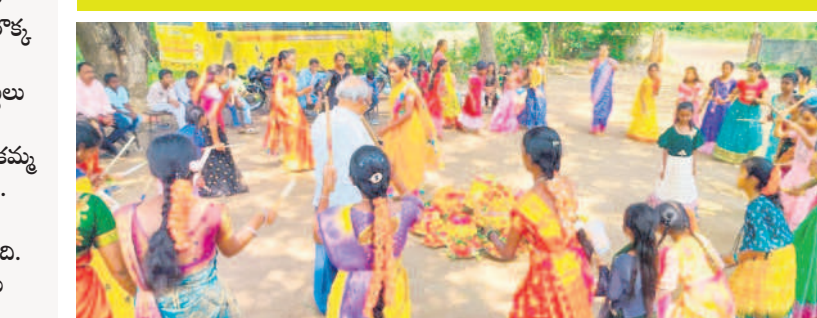
వేంసూరు: బతుకమ్మ చుట్టూ తిరుగుతూ కోలాహలము తీసుకున్న విద్యార్థినులు

పాఠశాలల్లో పూల పండుగ.. ● బతుకమ్మలను పేర్లి ఆడిపాడిన విద్యార్థులు, ఉపాధ్యాయులు ● గౌరమ్మలకు ప్రత్యేక పూజలు