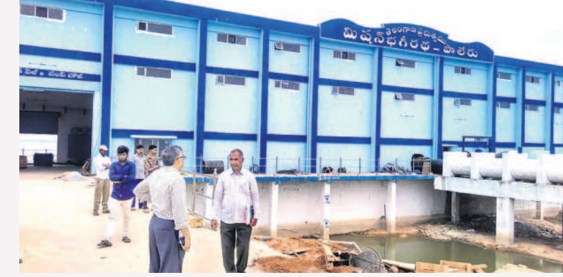
పాలేరు లిజర్వాయర్ వద్ద ఇనీటీకె వెల్

సాగర్ జలాలను ఇరిగేషన్ అధికారులు 'మిషన్ భగీరథ' కు తీసుకువచ్చారు. పాలేరు ఇనీటీకె వెల్ నుంచి పాత పరంగాల్ జిల్లాలోపాటు తిరుమల లాంఛనాలను మండలంపై కష్టజలం తరలించేందుకు అధికారులు 540 కిలోవాట్స్ సామర్థ్యం, 724 హెచ్పీ కలిగిన ఆరు బాటి మోటర్లు, జీజీచెరువు డబ్ల్యూటీపీ పరిధిలో 180 కిలోవాట్ల సామర్థ్యం, 240 హెచ్పీ కలిగిన ఆరు మోటర్లు ఏర్పాటు చేశారు.