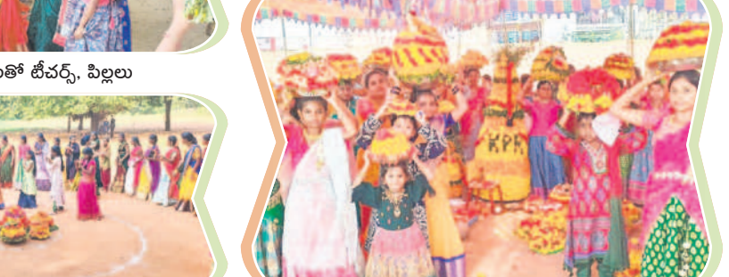
బీకులపల్లి : బతుకమ్మలతో బీవర్స్, విల్లలు