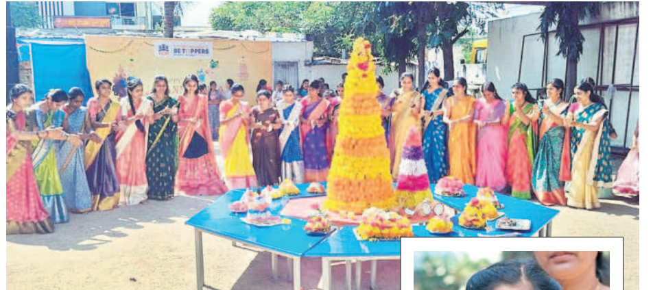
కామారెడ్డిలోని ఓ ప్రైవేట్ పాఠశాలలో బతుకమ్మ ఆడుతున్న విద్యార్థులు