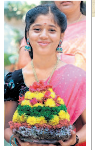
లో ప ల పి జి ల్లో