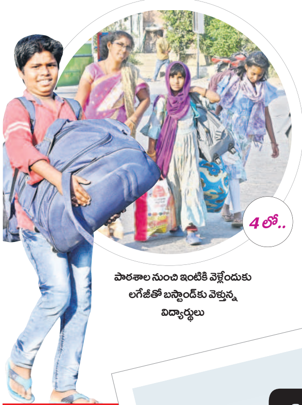
పాఠశాల నుంచి ఇంటికి వెళ్లేందుకు లగ్జితో బస్టాండ్ కు వెళ్తున్న విద్యార్థులు

ప్రభుత్వ, ప్రైవేట్ పాఠశాలలు గురువారం సందడిగా మారాయి. శుక్రవారం నుంచి సెలవులు ప్రకటించడంతో బడుల్లో గురువారమే బతుకమ్మ వేడుకలు నిర్వహించారు. విద్యార్థులు, ఉపాధ్యాయులు కలిసి బతుకమ్మలు పేర్చి, పాటలు పాడుతూ సందడి చేశారు. అనంతరం స్థానిక చెరువులు, జలాశయాల్లో బతుకమ్మలను నిమజ్జనం చేశారు.