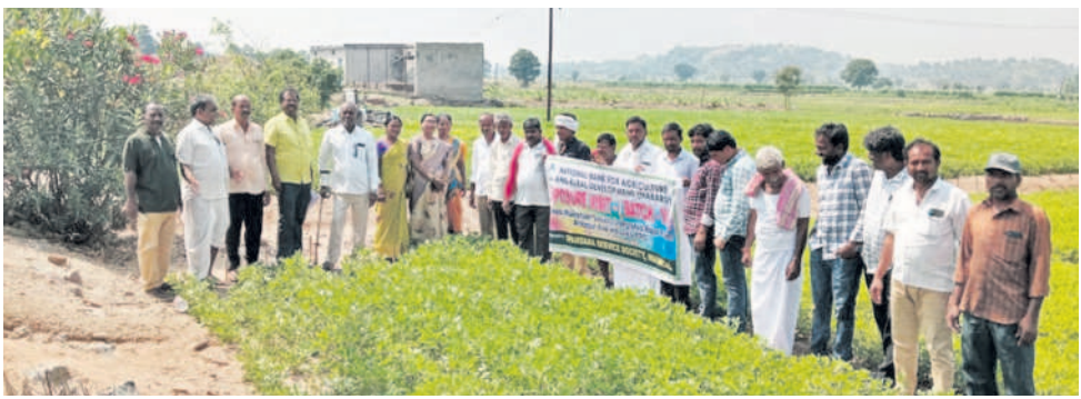
అంకాపూర్ లో పంటలను పరిశీలిస్తున్న మహబూబాబాద్ జిల్లా రైతులు

ఆర్కూర్, అక్టోబర్ 12 : నాబార్డీ సహకారంతో స్పందన సర్వీసెస్ సొసైటీ ఆధ్వర్యంలో మహబూబాబాద్ జిల్లా మరిపెడ మండల కేంద్రం, తొర్రూర్ మండలం ప్రతాపరుద్ర శ్రీయోధిలాషి ఆశ్రమ, సమృద్ధి రైతు ఉత్పత్తిదారుల సంఘాల రైతులు గురువారం ఆర్కూర్ మండలంలోని అంకాపూర్ ను సందర్శించారు. ఈ