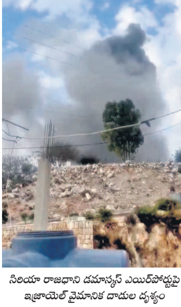
సిరియా రాజధాని డమాస్కస్ ఎయిర్పోర్టుపై ఇజ్రాయేల్ వైమానిక దాడుల దృశ్యం

ఎయిర్పోర్టులపై ఇజ్రాయేల్ వైమానిక దాడులు నిన్ను తెబనాన్ లోని టార్గెట్లపై కూడా బాంబులు