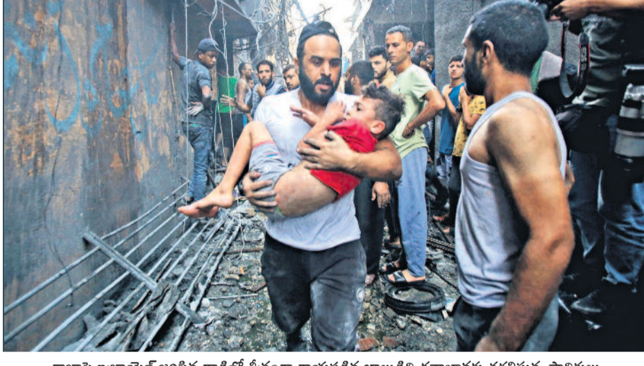
గాజాపై ఇజ్రాయేల్ జరిపిన దాడిలో తీవ్రంగా గాయపడిన బాలుడిని దవాఖానకు తరలిస్తున్న స్థానికులు

రైల్వే రిజర్వేషన్ బదిలీ చేసుకోవచ్చు ప్రయాణికులకు రైల్వేశాఖ వెనుకబాటు కుటుంబీకులకు టీకెట్ బదలాయించొచ్చు 24 గంటల ముందు రిక్వెస్ట్ తప్పనిసరి > 2