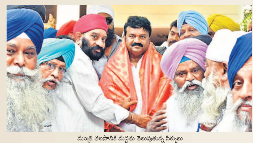
మంత్రి తలసానికే మద్దతు తెలుపుతున్న సిక్కులు