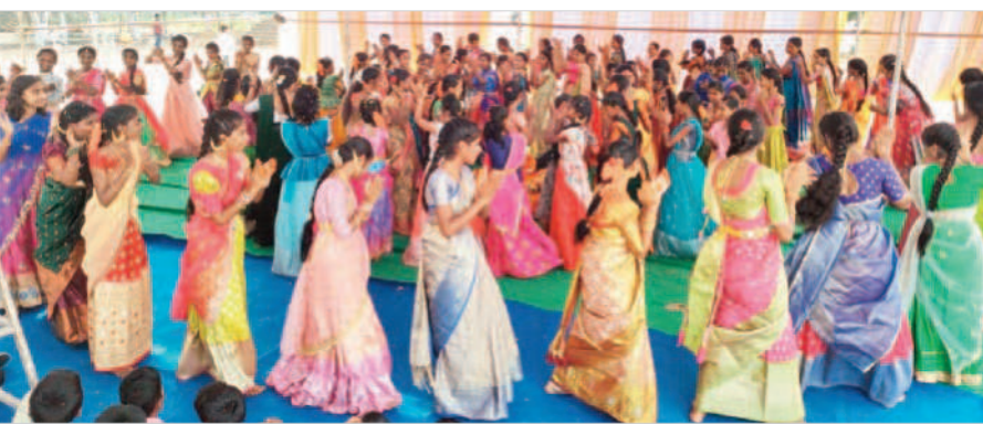
దేవరకర్ణ: డోకూర్ గ్రామ సమీపంలోని హైస్కూల్ లో బతుకమ్మ ఉత్సవాలు జరుపుకొంటున్న విద్యార్థినులు

మూసాపేట, అక్టోబర్ 12 : ప్రభుత్వ పాఠశాలలో పరిక్షలు ముగిసి దసరా నవరాత్రి ఉత్సవాల సెలవులు రావడంతో విద్యార్థులు బతుకమ్మలతో ఆడి పాడారు. మండల కేంద్రంలోపాటు నిజాలపూర్, పోల్కంపల్లి, జానంపేట, వేముల, నందిపేట, దాసరిపల్లి, కొమిరెడ్డిపల్లి, అచ్చాయిపల్లి, తుంకినీపూర్, సంకలమద్ది, చక్రపూర్ తదితర గ్రామాల్లోని ప్రభుత్వ పాఠశాలల విద్యార్థులు ప్రత్యేకించి బతుకమ్మలను తయారు చేసుకోని పాఠశాలలకు వచ్చారు. పాఠశాలల అవరణలో బతుకమ్మలకు పూజలు నిర్వహించారు. అనంతరం బతుకమ్మ పాటలు పాడుతూ స్వత్యం చేశారు. కార్యక్రమంలో ఆయా పాఠశాలల ప్రధానోపాధ్యాయులు, ఉపాధ్యాయులు, విద్యార్థులు పాల్గొన్నారు.