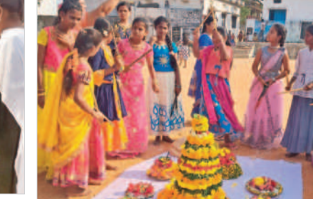
కొత్తకోటలో : బతుకమ్మ ఆడుతున్న విద్యార్థినులు