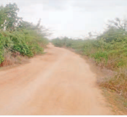
బీటీ రోడ్లుగా మారనున్న నాగన్నపల్లి గ్రామ మట్టిరోడ్డు

గ్రామం నుంచి కోయిల్ సాగర్ రోడ్డు వరకు 2.87 కిలో మీటరు వరకు రూ. కోటి 60 లక్షలు, చిన్నరాజమూర్-బోలరం నుంచి నాగన్నపల్లి వరకు 1.70 కిలోమీటర్లకు రూ. కోటి 83 లక్షలు, మూసాపేట మండలంలోని జాతీయ రహదారి నుంచి తాళ్లగడ్డ వరకు 2.50 కిలో మీటర్ల వరకు రూ. 2.50 కోట్లు, చిన్నచింతకుంట మండలంలోని పీడబ్యూ రోడ్డు నుంచి కౌకుంట్ల వరకు 4.65 కిలో మీటర్లకు రూ. 3 కోట్లు, ముచ్చింతల నుంచి కౌకుంట్ల వరకు 4.50 కిలో మీటర్ల వరకు రూ. 3 కోట్లు, భూ తూర్ మండలం హన్మపూర్ గ్రామ బీటీ రోడ్డు 3.50 కిలో మీటర్ల వరకు రూ. 3.50 కోట్లు, అడ్డాకుల మండలంలో జెడ్పీ రోడ్డు నుంచి