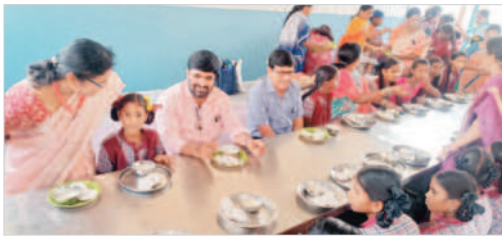
విద్యార్థులతో కలిసి టిఫిన్ చేస్తున్న డీకావో