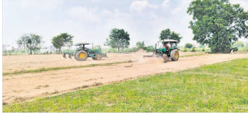
బహిరంగ సభాస్థలాన్ని డోజర్లతో చదును చేస్తున్న ధ్వజం