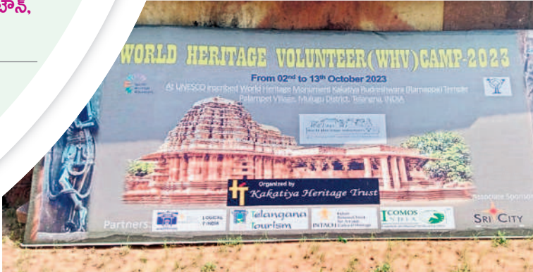
రామప్పలో వరల్డ్ హిరికోట వలంటీర్స్ క్యాంపెయన్ ఫైట్

మారుతున్న సాంకేతిక పరిజ్ఞాన్ని అందించుకునే నేలా ఎన్ని కల కమిషన్ ఆన్లైన్లోనూ అభ్యర్థులు నామినేషన్లు సమర్పించేలా ఏర్పాటు చేసింది. ఈ మేరకు సువిధ యాప్ ను అందుబాటులోకి తీసుకొచ్చింది. యాప్ లో అన్ని వివరాలను నమోదు చేసి, నిర్దిష్ట సమయంలో స్లాట్ బుకింగ్ చేసుకోవాలి, ఉంటుంది. చివరి రోజు నేరుగా ఎన్ని కల లిటర్లింగ్ అధికారికి మూడు సెట్ల పత్రాలు అందిస్తేనే నామినేషన్ దాఖలు చేసినట్లు భావిస్తారు. - ములుగుశోన్, అక్టోబర్ 12