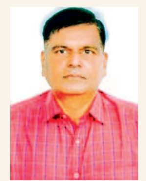
కాకతీయల ఖ్యాతి విశ్వవ్యాప్తం కోసం..