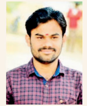
టూరిజం హాట్ గా ములుగు