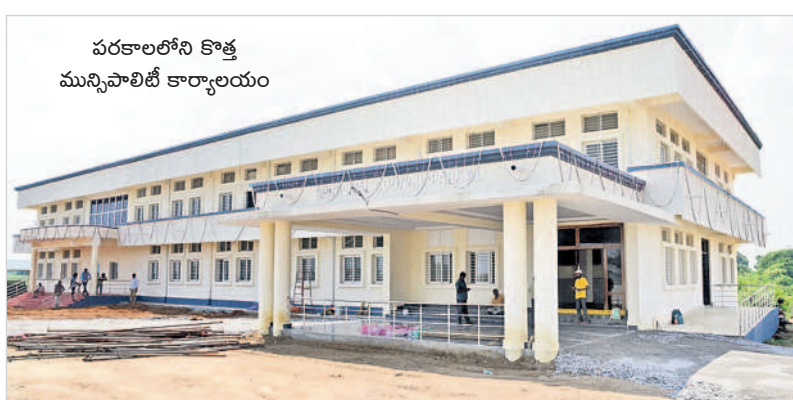
పరకాలలోని కొత్త మున్సిపాలిటీ కార్యాలయం

పరకాల, అక్టోబర్ 12 : బీఆర్ఎస్ సర్కారు చొరవతో పరకాల పట్టణం అభివృద్ధి పథాన ముందుకు పోతున్నది. నాడు ఉమ్మడి పాలనలో పరకాల రెవెన్యూ డివిజన్ కల నెరవేరకపోగా తెలంగాణ ఏర్పడిన తర్వాత ఇక్కడి ప్రజల బిరకాల వాంఛ నెరవేరింది. పరకాల రెవెన్యూ డివిజన్ తో పాటు, పురపాలక సంఘం, తహసీల్దార్ కార్యాలయాలకు కొత్త భవనాలను తెలంగాణ ప్రభుత్వం కార్పొరేట్ స్థాయిలో నిర్మించింది. రూ.4.8కోట్లతో మున్సిపాలిటీ భవనం, రూ.2.8కోట్లతో రెవెన్యూ డివిజన్ కార్యాలయం, రూ.2.15కోట్లతో తహసీల్దార్ కార్యాలయాలను ఆధునిక పనతులతో నిర్మించగా, ఇటీవలే ఎమ్మెల్యే చల్లా ధర్మాధర్షి అధికారులతో కలిసి ప్రారంభించారు. పరకాల రెవెన్యూ డివిజన్ కావడంతో పాటు కార్పొరేట్ తరహా సర్కారు పాలనా భవనాలు అందుబాటులోకి రావడంతో పట్టణవాసులు హర్షం వ్యక్తం చేస్తున్నారు.