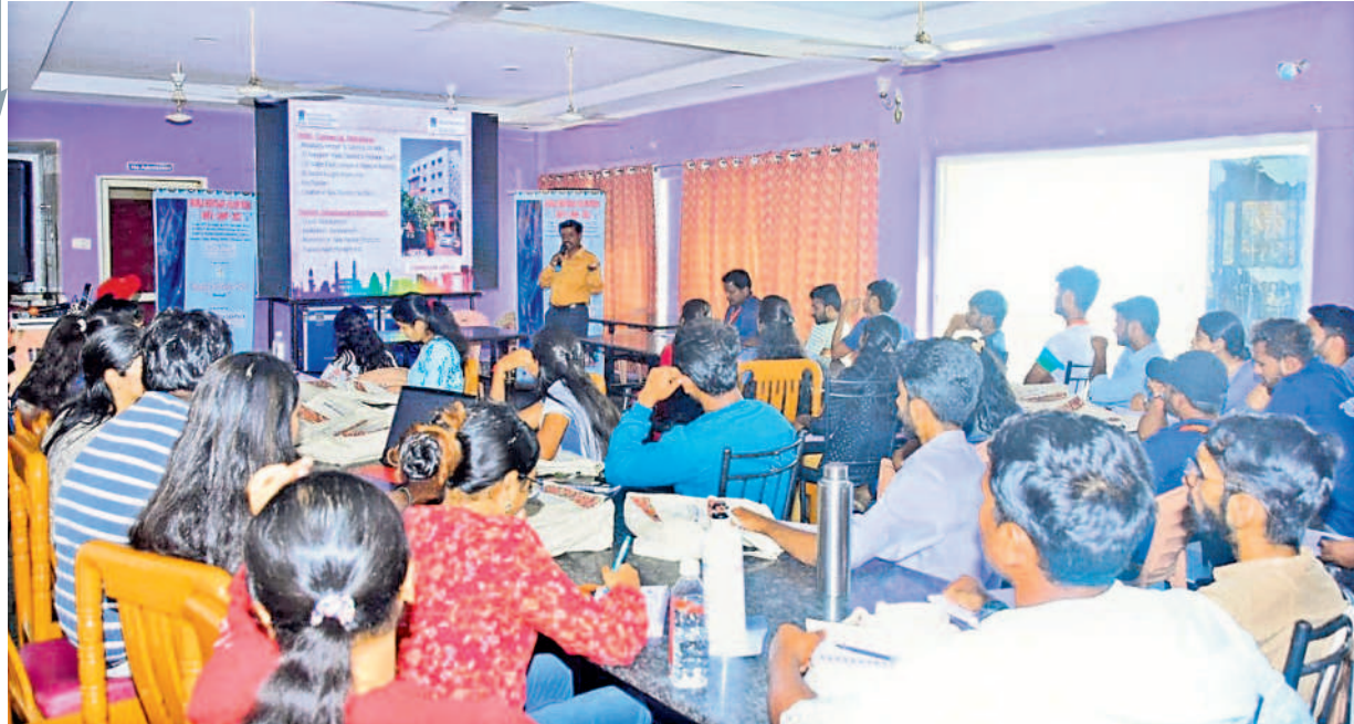
క్యాంపెయన్ లో వలంటీర్లు