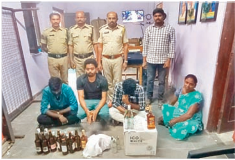
పుల్లూరులో పట్టుబడిన మద్యంతో పోలీసులు