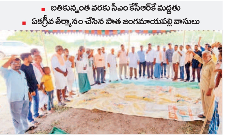
తమ మద్దతును ప్రకటిస్తున్న పాతజంగమాయపల్లి గ్రామస్థులు