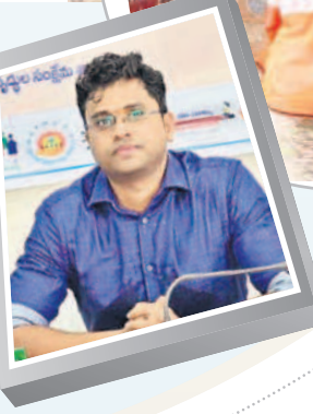
—ఉదయకుమార్, జిల్లా ఎన్నికల అధికారి, కలెక్టర్

జిల్లాలో ఎన్నికల ప్రశాంతంగా, పక్కదండీగా నిర్వహించేందుకు ఏర్పాట్లు చేపడుతున్నారు. ఎన్నికల కోడ్ అమలులోకి రావడంతో ఆయా పార్టీలకు నిబంధనలపై వివరించడం జరిగింది. చెక్ పోస్టులను ఏర్పాటు చేశారు. సగదు, బంగారం, మద్యం రవాణాలో నిబంధనల ప్రకారం వ్యవహరించాలి. రాజకీయ పార్టీలు ఎన్నికల నిబంధనల అమలులో అధికారులకు సహకరించాలి. ఎలాంటి సమావేశాలకైనా అనుమతులు తీసుకోవాలి. ఎన్నికల నిర్వహణలో పారదర్శకంగా చర్యలు తీసుకోనేలా అధికారులు, సిబ్బందికి ఆదేశాలు జారీ చేశారు. ఇంకా కొత్త ఓటర్లు ఉంటే వీర్లు నమోదు చేసుకోనే అవకాశం కల్పించారు.