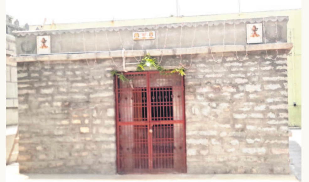
శ్రీహయగ్రీవ స్వామి ఆలయం