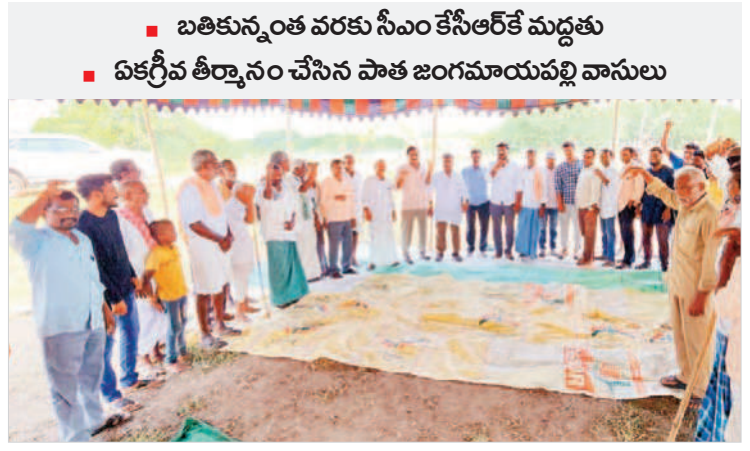
■ బలికున్నంత వరకు సీఎం కేసీఆర్ కే మద్దతు ■ ఏకగ్రీవ తీర్మానం చేసిన పాత జంగమాయపల్లి వాసులు