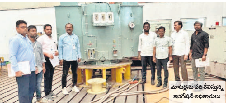
మోటర్లను పరిశీలిస్తున్న ఇరిగేషన్ అధికారులు