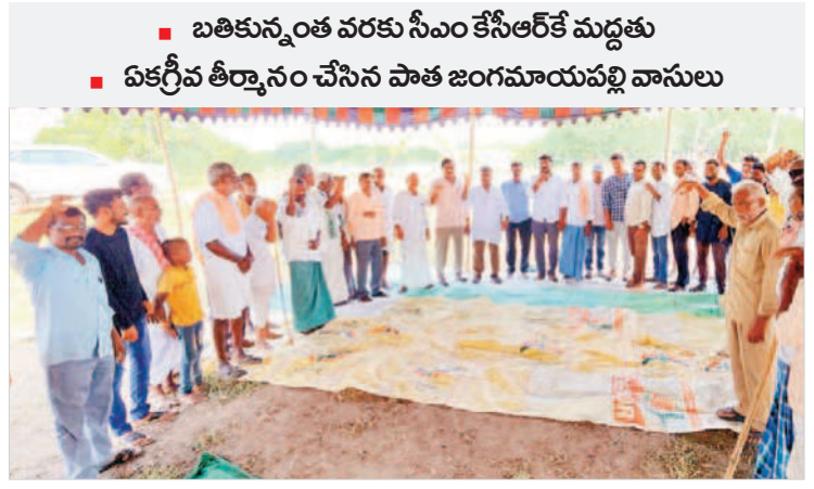
తమ మద్దతును ప్రకటిస్తున్న పాతజంగమాయపల్లి గ్రామస్థులు

కొత్తకోట, అక్టోబర్ 12 : 'ఎమ్మెల్యే ఆల వెంకటేశ్వర్ రెడ్డికి మా ఓటు' అంటూ కొత్తకోట మండలంలోని పాతజంగమాయపల్లి గ్రామస్థులు గురువారం ఏకగ్రీవ తీర్మానం చేశారు. ఈ సందర్భంగా గ్రామస్థులు మాట్లాడుతూ కనిమెట్ల-పాతజంగమాయపల్లి గ్రామాల మద్య ఊకచెట్టు వాగుపై బ్రిడ్జిని ఏర్పాటు చేయాలని ఉమ్మడి రాష్ట్రంలో సీఎంల చంద్రబాబునాయుడు, చైఎస్సార్ కు ఎన్నో సార్లు విన్నవించుకున్నామన్నారు. ముఖ్యమంత్రులు, ఎమ్మెల్యేలు మారినా తమ సమస్య మాత్రం తీరలేదన్నారు. ఉద్యమనేత అయిన కేసీఆర్ ముఖ్యమంత్రి, ఆల వెంకటేశ్వర్ రెడ్డికి ఎమ్మెల్యేగా ఏర్పాటుయ్యాక తమ కష్టాలను చూసి చలింబి బ్రిడ్జి నిర్మాణం చేపడుతామని హామీ ఇచ్చారన్నారు. ఇందుకుగానూ బ్రిడ్జి నిర్మాణం కోసం రూ.12.35 కోట్ల కేటాయింపగా.. 80 శాతం పనులు పూర్తయ్యాయన్నారు. పూర్తి స్థాయిలో అందుబాటులోకి వస్తే 14 గ్రామాల ప్రజల కష్టాలు తీరనున్నాయన్నారు. అంతేకాకుండా పాతజంగమాయపల్లి గ్రామానికి బ్రిడ్జిపోటు నూతన గ్రామ పంచాయతీని ఏర్పాటు చేసేందుకు జీవో వెలువడిందన్నారు. గ్రామానికి ఇంతగా మంచి చేస్తున్న సీఎం కేసీఆర్, ఎమ్మెల్యే ఆల వెంకటేశ్వర్ రెడ్డికి మద్దతు ప్రకటిస్తామని ఏకగ్రీవ తీర్మానం చేసుకున్నామన్నారు. తమ తలరాత మారుస్తున్న వారిని ప్రత్యక్ష దైవంగా భావిస్తున్నామన్నారు. బలికున్నంత వరకు సీఎం కేసీఆర్ వైపే నడుస్తామన్నారు.