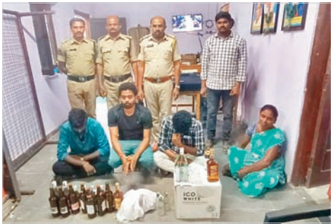
పుల్లూరులో పట్టుబడిన మద్యంతో పోలీసులు