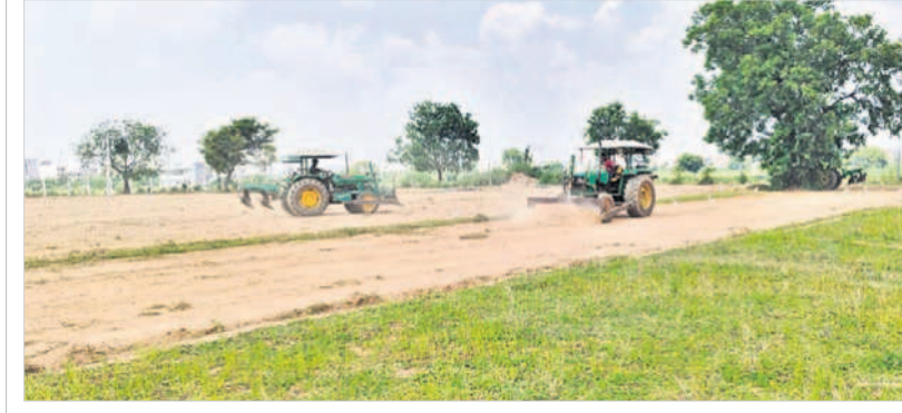
బహిరంగ సభాస్థలాన్ని దోబ్బడతో చదును చేస్తున్న ధ్వజం