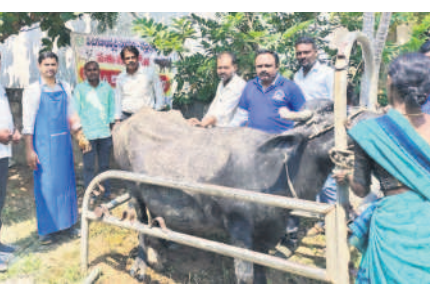
పశువైద్య శిబిరంలో పాల్గొన్న వైద్యాధికారులు

చౌటుప్పల రూరల్, అక్టోబర్ 12 : మండలంలోని స్వాములవారి లింగోటం గ్రామంలో పశుగణాభివృద్ధి సంస్థ ఆధ్వర్యంలో గురువారం గర్భకోశ వ్యాధి చికిత్స శిబిరం నిర్వహించారు. ఈ సందర్భంగా రైతులకు ఆయన పశువుల పెంపకంపై పలు సూచనలు చేశారు. పశువులకు వ్యాధులు రాకుండా టీకాలు వేయించాలని తెలిపారు. శిబిరంలో 35 పశువులకు గర్భకోశ వ్యాధి చికిత్సలు, 150 పశువులకు గాలికుంటు వ్యాధి టీకాలు వేశారు. కార్యక్రమంలో ఉమ్మడి నల్లగొండ జిల్లా ఈడె పాశం శ్రీని