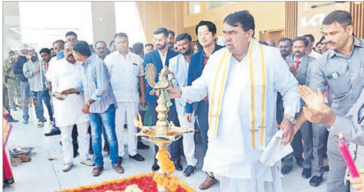
కియా షోరూంను ప్రారంభిస్తున్న అసెంబ్లీ స్పీకర్ పోచారం శ్రీనివాసరెడ్డి

డివ్‌పల్లి, అక్టోబర్ 12 : జిల్లాకు అంతర్జాతీయ ఆటోమొబైల్ కంపెనీలు వరుస కడుతున్నాయి. ఇందులో భాగంగా మరో ప్రఖ్యాత ఆటోమొబైల్ కంపెనీ తమ షోరూమ్‌ను జిల్లాలో ఏర్పాటు చేసింది. నిజామాబాద్ నగర శివారులో గురువారం కియా నూతన షోరూంను అసెంబ్లీ స్పీకర్ పోచారం శ్రీనివాసరెడ్డి కియా రిజనల్ మేనేజర్