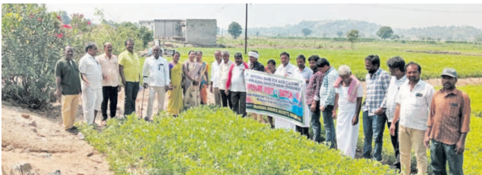
అంకాపూర్లో పంటలను పరిశీలిస్తున్న మహబూబాబాద్ జిల్లా రైతులు

ఆర్కూర్, అక్టోబర్ 12 : నాబార్డీ సహకారంతో స్పందన సర్వీసెస్ సొసైటీ ఆధ్వర్యంలో మహబూబాబాద్ జిల్లా మరిపెడ మండల కేంద్రం, తొర్రూర్ మండలం ప్రతాపరుద్ర శ్రీయోధిలాషి ఆకీరు, సమృద్ధి రైతు ఉత్పత్తిదారుల సంఘాల రైతులు గురువారం ఆర్కూర్ మండలంలోని అంకాపూర్ ను సందర్శించారు. ఈ