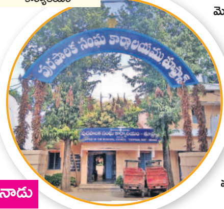
తూప్రాన్ పాత మున్సిపల్ కార్యాలయం