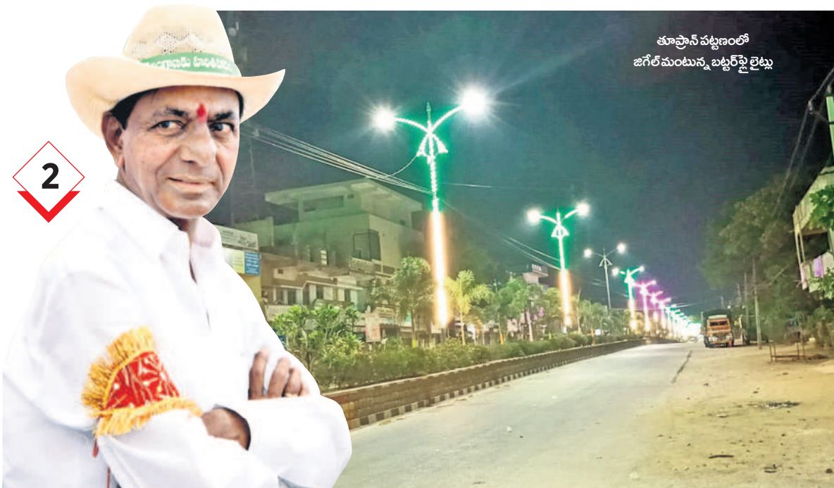
తూప్రాన్ పట్టణంలో జగేల్ మంటున్న బట్టర్ ఫైలైట్లు