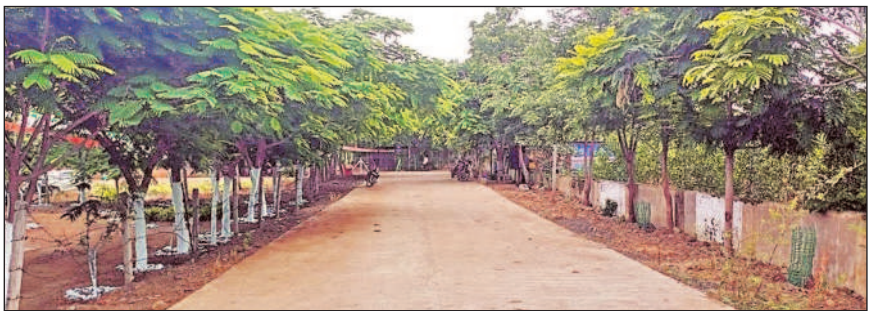
రోడ్డుకు ఇరు వక్కలా ఏపుగా పెరిగిన చెట్లు