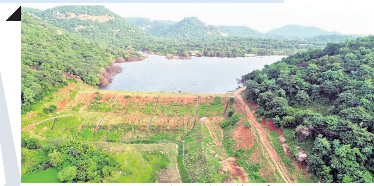
చుట్టూ గుట్టలు, ప్రకృతి అందాల మధ్య మహాసముద్రం గండి

సీఎం కేసీఆర్ విజన్తో 'మహాసముద్రం' చెరువుకు మహర్షక