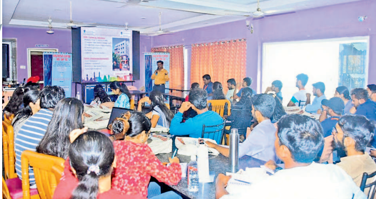
క్యాంపెయన్ లో వలంటీర్లు