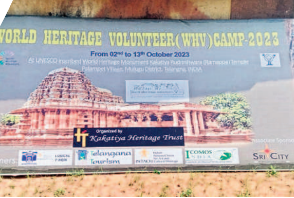
రామప్పలో వరల్డ్ హెరిటేజ్ వలంటీర్స్ క్యాంపెయన్ ఫైట్

వెంకటాపూర్, అక్టోబర్ 12 : రామప్ప ఆలయ ఖ్యాతిని విశ్వవ్యాప్తం చేసేందుకు ఇక్కడ 11 రోజులుగా 'వరల్డ్ హెరిటేజ్ వలంటీర్స్ క్యాంపెయన్'ను 'వర్కొంగ్ ఆన్ ద ప్యూచర్' అనే థీమ్ తో నిర్వహించారు. రాష్ట్ర పర్యాటక శాఖ, ఐకోమస్ ఇండియా, కేంద్ర పురావస్తు శాఖ, ఇంటాక్ సంస్థల సహకారంతో కాకతీయ హెరిటేజ్ ట్రస్ట్ ఆధ్వర్యంలో కొనసాగింది. 33 దేశాల్లో 74 క్యాంపెయన్ ఏర్పాటు చేయగా, దేశవ్యాప్తంగా పది చోట్ల నిర్వహిస్తున్నారు. కొత్తగా ఎంపికైన వారసత్వ కట్టడాల గురించి ఆన్లైన్లో చరిత్ర, ఆర్కియాలజీ, సివిల్ ఇంజనీరింగ్, టూరిజం, ఆర్కియాలజీ విద్యార్థులను సంబంధిత దరఖాస్తులను ఆప్టానింగ్ ఎంపికైన వలంటీర్లకు శిక్షణ ఇచ్చారు. ఆయా ప్రదేశాల చరిత్ర, ప్రత్యేకతలు, నిర్మాణశైలి, అప్పటి టెక్నాలజీ, సంస్కృతి, కళలు, గొప్పతనం, సంరక్షణ చర్యలు, స్థానిక జీవన విధానం, సంప్రదాయాల గురించి వివరించి వారితో తమ తమ ప్రదేశాల్లో ప్రచారం చేయిస్తారు. ఈ క్యాంపెయన్ ప్రపంచ వ్యాప్తంగా ఏప్రిల్ నుంచి డిసెంబర్ వరకు నిర్వహిస్తున్నారు. మన దేశంలో రామప్పలో నిర్వహించే క్యాంపెయన్ చివరిది. నివేదికను నవంబర్ 15 వరకు యునెస్కోకు సమర్పించనున్నారు. ఈ సారి 260 మంది దరఖాస్తు చేసుకోగా 40 మంది ఎంపికయ్యారు. 14 రాష్ట్రాలకు చెందిన 35 మంది వలంటీర్లు హాజరయ్యారు.