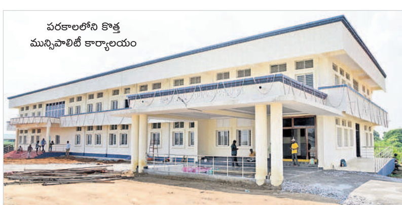
పరకాలలోని కొత్త మున్సిపాలిటీ కార్యాలయం

పరకాల, అక్టోబర్ 12 : బీఆర్ఎస్ సర్కారు చొరవతో పరకాల పట్టణం అభివృద్ధి పథాన ముందుకు పోతున్నది. నాడు ఉమ్మడి పాలనలో పరకాల రెవెన్యూ డివిజన్ కల నెరవేరకపోగా తెలంగాణ ఏర్పడిన తర్వాత ఇక్కడి ప్రజల బిరకాల వాంఛ నెరవేరింది. పరకాల రెవెన్యూ డివిజన్ తో పాటు, పురపాలక సంఘం, తహసీల్దార్ కార్యాలయాలకు కొత్త భవనాలను తెలంగాణ ప్రభుత్వం కార్పొరేట్ స్థాయిలో నిర్మించింది. రూ.4.8కోట్లతో మున్సిపాలిటీ భవనం, రూ.2.8కోట్లతో రెవెన్యూ డివిజన్ కార్యాలయం, రూ.2.15కోట్లతో తహసీల్దార్ కార్యాలయాలను ఆధునిక పనతులతో నిర్మించగా, ఇటీవలే ఎమ్మెల్యే చల్లా ధర్మాధర్షి అధికారులతో కలిసి ప్రారంభించారు. పరకాల రెవెన్యూ డివిజన్ కావడంతో పాటు కార్పొరేట్ తరహా సర్కారు పాలనా భవనాలు అందుబాటులోకి రావడంతో పట్టణవాసులు హర్షం వ్యక్తం చేస్తున్నారు.