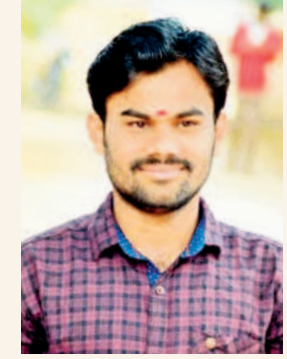
టూరిజం హాట్ గా ములుగు