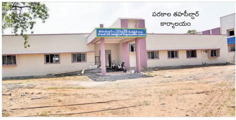
పరకాల తహసీల్దార్ కార్యాలయం