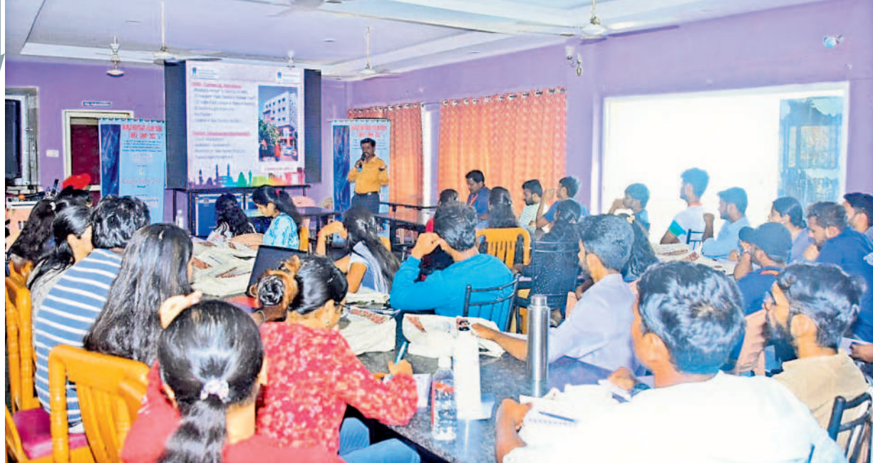
క్యాంపెయన్ లో వలంటీర్లు