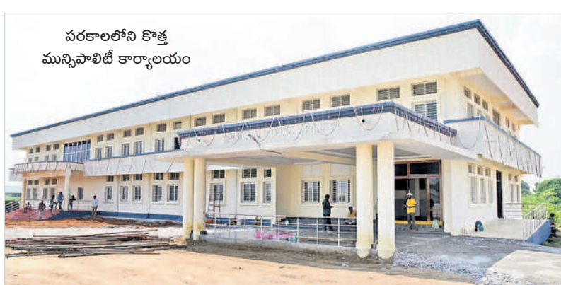
పరకాలలోని కొత్త మున్సిపాలిటీ కార్యాలయం

పరకాల, అక్టోబర్ 12 : బీఆర్ఎస్ సర్కారు చొరవతో పరకాల పట్టణం అభివృద్ధి పథకాన ముందుకు పోతున్నది. నాడు ఉమ్మడి పాలనలో పరకాల రెవెన్యూ డివిజన్ కల నెరవేరకపోగా తెలంగాణ ఏర్పడిన తర్వాత ఇక్కడి ప్రజల బిరకాల వాంఛ నెరవేరింది. పరకాల రెవెన్యూ డివిజన్ తో పాటు, పురపాలక సంఘం, తహసీల్దార్ కార్యాలయాలకు కొత్త భవనాలను తెలంగాణ ప్రభుత్వం కార్పొరేట్ స్థాయిలో నిర్మించింది. రూ.4.8కోట్లతో మున్సిపాలిటీ భవనం, రూ.2.8కోట్లతో రెవెన్యూ డివిజన్ కార్యాలయం, రూ.2.15కోట్లతో తహసీల్దార్ కార్యాలయాలను ఆధునిక పనతులతో నిర్మించగా, ఇటీవలే ఎమ్మెల్యే చల్లా ధర్మాధర్షి అధికారులతో కలిసి ప్రారంభించారు. పరకాల రెవెన్యూ డివిజన్ కావడంతో పాటు కార్పొరేట్ తరహా సర్కారు పాలనా భవనాలు అందుబాటులోకి రావడంతో పట్టణవాసులు హర్షం వ్యక్తం చేస్తున్నారు.