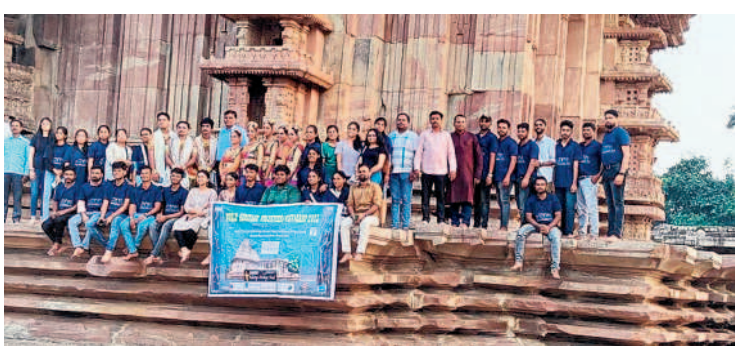
రామప్పలో వరల్డ్ హిరికోట వలంటీర్స్ క్యాంపెయన్ ఫైట్

వెంకటాపూర్, అక్టోబర్ 12 : రామప్ప ఆలయ ఖ్యాతిని విశ్వవ్యాప్తం చేసేందుకు ఇక్కడ 11 రోజులుగా 'వరల్డ్ హిరికోట వలంటీర్స్ క్యాంపెయన్'ను 'వర్కంగ్ ఆన్ ద ప్యూచర్' అనే థీమ్ తో నిర్వహించారు. రాష్ట్ర పర్యాటక శాఖ, ఐకోమస్ ఇండియా, కేంద్ర పురావస్తు శాఖ, ఇంటాక్ సంస్థల సహకారంతో కాకతీయ హిరికోట ప్రస్థానాన్ని అభ్యర్థించే కొనసాగించారు. 33 దేశాల్లో 74 క్యాంపెయన్ ఏర్పాటు చేయగా, దేశవ్యాప్తంగా పది చోట్ల నిర్వహిస్తున్నారు. కొత్తగా ఎంపికైన వారసత్వ కట్టడాల గురించి ఆన్లైన్లో చరిత్ర, ఆర్కియాలజీ, సివిల్ ఇంజనీరింగ్, టూరిజం, ఆర్కియాలజీ విద్యార్థులు సువిచిత్ర దరఖాస్తులను ఆప్లై చేసి ఎంపికైన వలంటీర్లకు శిక్షణ ఇచ్చారు. ఆయా ప్రదేశాల చరిత్ర, ప్రత్యేకతలు, నిర్మాణశైలి, అప్పటి టెక్నాలజీ, సంస్కృతి, కళలు, గొప్పతనం, సంరక్షణ చర్యలు, స్థానిక జీవన విధానం, సంప్రదాయాల గురించి వివరించి వారితో తమ తమ ప్రదేశాల్లో ప్రచారం చేయిస్తారు. ఈ క్యాంపెయన్ ప్రపంచ వ్యాప్తంగా ఏప్రిల్ నుంచి డిసెంబర్ వరకు నిర్వహిస్తున్నారు. మన దేశంలో రామప్పలో నిర్వహించే క్యాంపెయన్ చివరిది. నివేదికను నవంబర్ 15 వరకు యునెస్కోకు సమర్పించనున్నారు. ఈ సారి 260 మంది దరఖాస్తు చేసుకోగా 40 మంది ఎంపికయ్యారు. 14 రాష్ట్రాలకు చెందిన 35 మంది వలంటీర్లు హాజరయ్యారు.